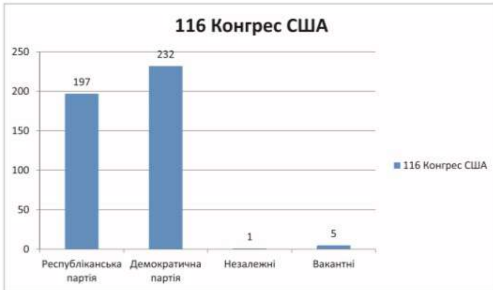
Рис. 1. 116 Конгрес США

ням «Pew Research» половини дорослого електорату, адже лише 6% виборців «говорять, що вони можуть голосувати за невіруючого» [2]. Протестантські фундаменталісти мають вагомий вплив і лобі.