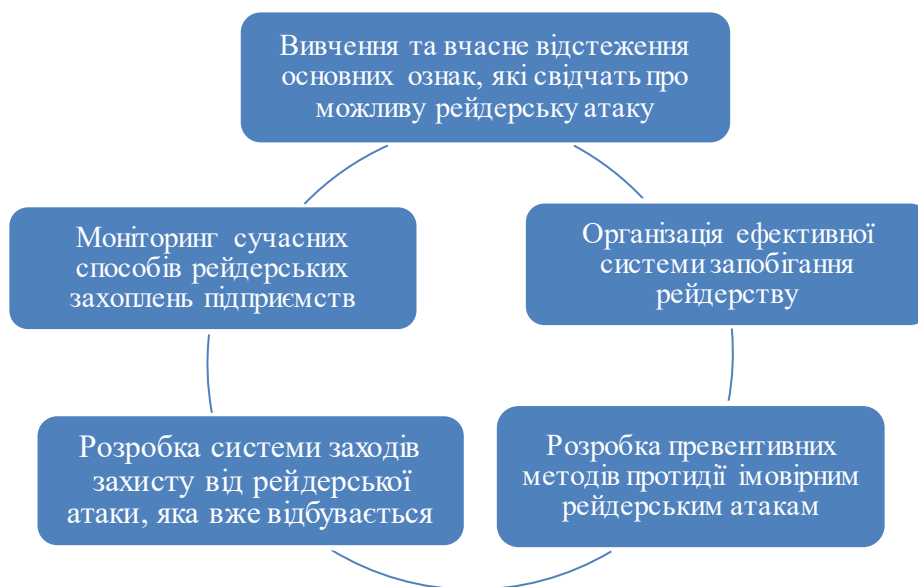
Рис. 3. Механізм протидії рейдерству на підприємстві