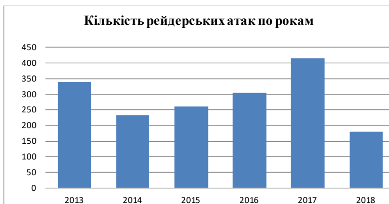
Рис. 1. Кількість рейдерських атак по роках