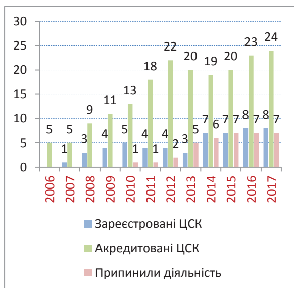
Динаміка кількості суб'єктів сфери електронного цифрового підпису (2006–2017)

Відповідно до європейського законодавства Закон запроваджує визначення «електронна позначка часу», «кваліфікована електронна печатка», «схема електронної ідентифікації», «кваліфікований надавач електронних довірчих послуг», «реєстрована електронна доставка», «удосконалена електронна печатка». На думку законотворців, таке юридичне зближення термінології в сфері електронного підпису позитивно сприятиме формуванню в майбутньому спільних міждержавних регуляторних актів.