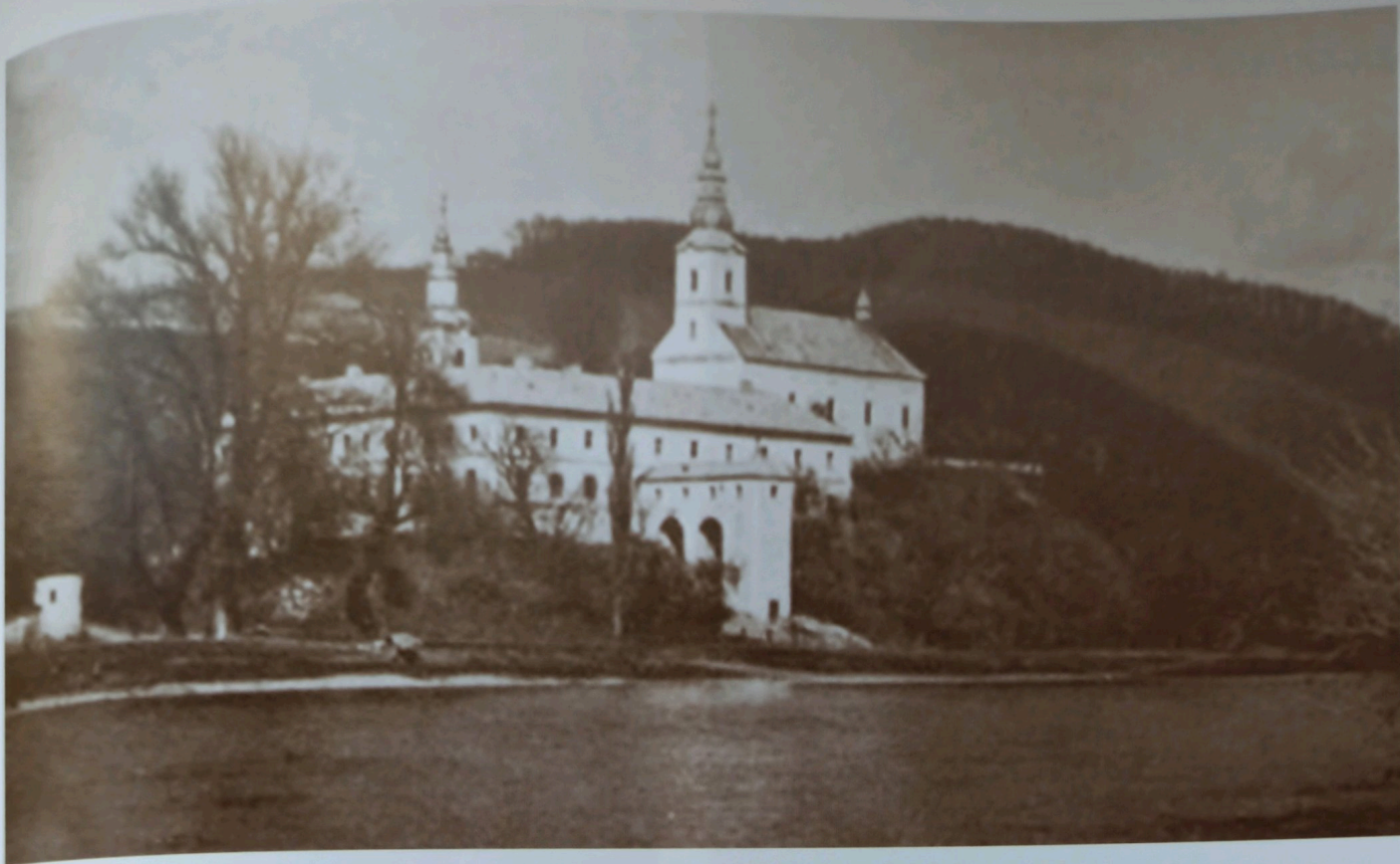
Мукачівський Свято-Миколаївський монастир

Перші акції проти православного духовенства розпочалися паралельно з репресіями проти греко-католиків. Арешти торкнулися як рядових священників і ченців, так і вищого церковного керівництва. Звинувачення, за якими виносили вироки, можна умовно поділити на чотири групи: співпраця з угорським та німецьким окупаційними режимами, антирадянська агітація і пропаганда, сприяння групам українських націоналістів, економічні злочини. Дуже часто ці звинувачення перепліталися, що давало можливість засудити священника від 5 до 25 років.