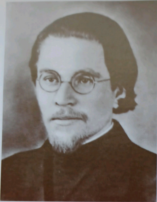
Ігумен Феофан (Сабов), убитий в 1946 р.

Засудити арештованого не встигли, він помер 9 березня 1946 р. 8 Реабілітований 1992 р. 9