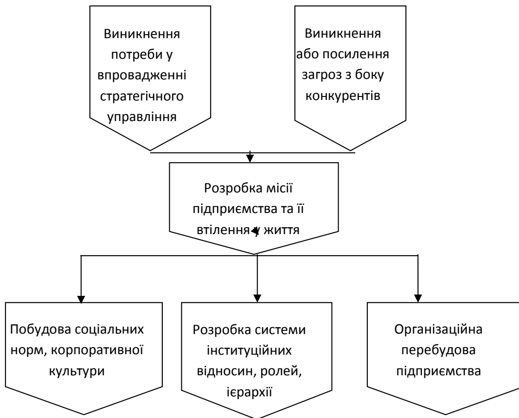
Рис. 1. Алгоритм інституціалізації стратегічного управління підприємством