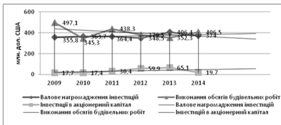
Рис. 1. Тенденція та прогноз динаміки нагромадження інвестиційного капіталу Закарпатської області, млн. дол. США (лінійний тренд) [3]

Для дослідження динаміки інвестиційного процесу Закарпатської області можна використовувати як лінійні, так і не лінійні моделі. Аналізуючи динаміку валового нагромадження інвестиційного капіталу в Закарпатській області доцільним вважаємо застосування лінійного тренду як найбільш коректного та толерантного методу. Якщо проаналізувати дані по нагромадженню прямих іноземних інвестицій відносно інших складових інвестиційного процесу за даними у таблиці 1 за допомогою лінійного тренду, отримаємо наступні результати (рис. 1.)