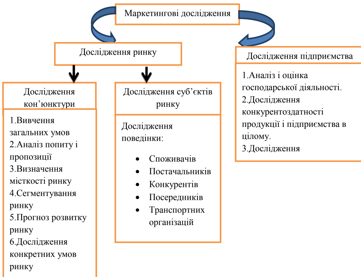
Рис. 1. Структура маркетингових досліджень [3, с. 66]

Маркетингове дослідження зазвичай починається із збирання вторинної інформації, яке ще називається «кабінетним дослідженням». Складові елементи маркетингових досліджень подані на рис. 1