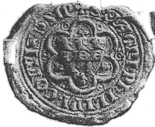
Рис. 1: Відтиск печатки Філіпа I Другета 1318 року [34, с. 295].

Key words: seal, coat of arms, heraldry, nobility, symbol, sphragistics, figure.