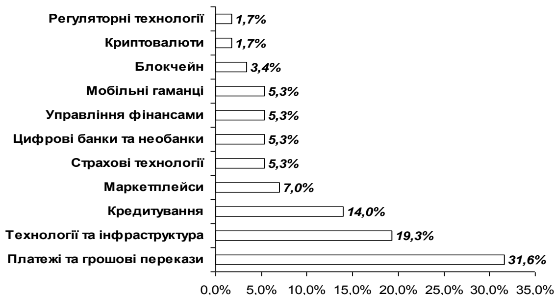
Рис. 2. Сфери діяльності фінтех-компаній в Україні у 2019 році*

Що стосується України, то лише протягом 2019 року тут з'явилося понад 70 нових фінтех-компаній, що складає майже 40 % їх загальної кількості. Загалом на початок 2020 року в Україні налічувалося 180 суб'єктів фінтех-індустрії, що у 2,5 рази перевищує кількість діючих банків [3]. На рис. 2 представлено напрями роботи фінтех-провайдерів України.