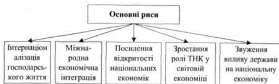
Схема .1. Основні риси економічної глобалізації

Глобалізація економіки - це багатогранні процеси, що відбуваються у світовому господарстві. При всій її багатоманітності можна виділити найхарактерніші риси чи ознаки, що розкривають суть економічної глобалізації (див. Схему 1).