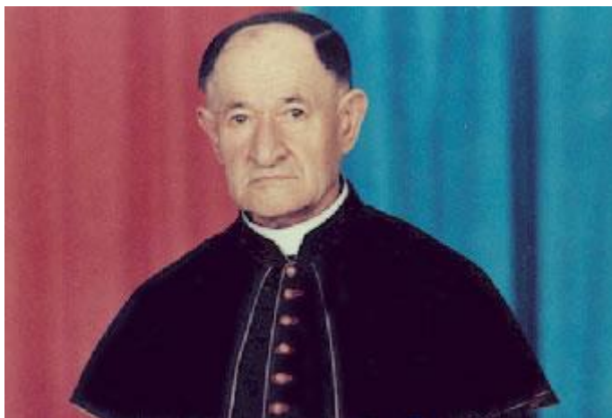
Єпископ Олександр Хіра

ногами. Потім кидали в карцер – бетонну клітину розміром півтора на півтора метра, висотою 2 метри. Там одна лиш бетонна приступка для сидіння. Так тримали його кілька днів без їжі. Хоч у ту пору Маргітич часом перевиконував виробничу норму, жодних поблажок за це не мав» 72 .