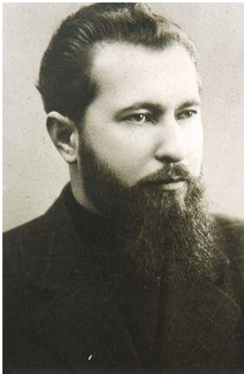
Єпископ Теодор Ромжа

Хрущова було організовано підступне вбивство єпископа Ромжі. Виконання цього злочину було доручено керівнику спецслужби «ДР» (диверсія і терор) міністерства держбезпеки СРСР Павлу Судоплатову» 62 . До речі, він сам у цьому зізнався 63 .