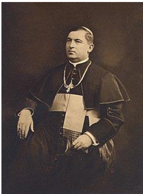
Єпископ Олександр Стойка

гуманною і за нас поклопотав. Я отримав амністію. Олександр Стойка, хоч вважав себе угорцем і виступав охоронцем угорської держави, заступався навіть за колишніх комуністів. Казав: «То є мої вірні. Я не можу дивитися байдуже, як їх переслідують» 56 .