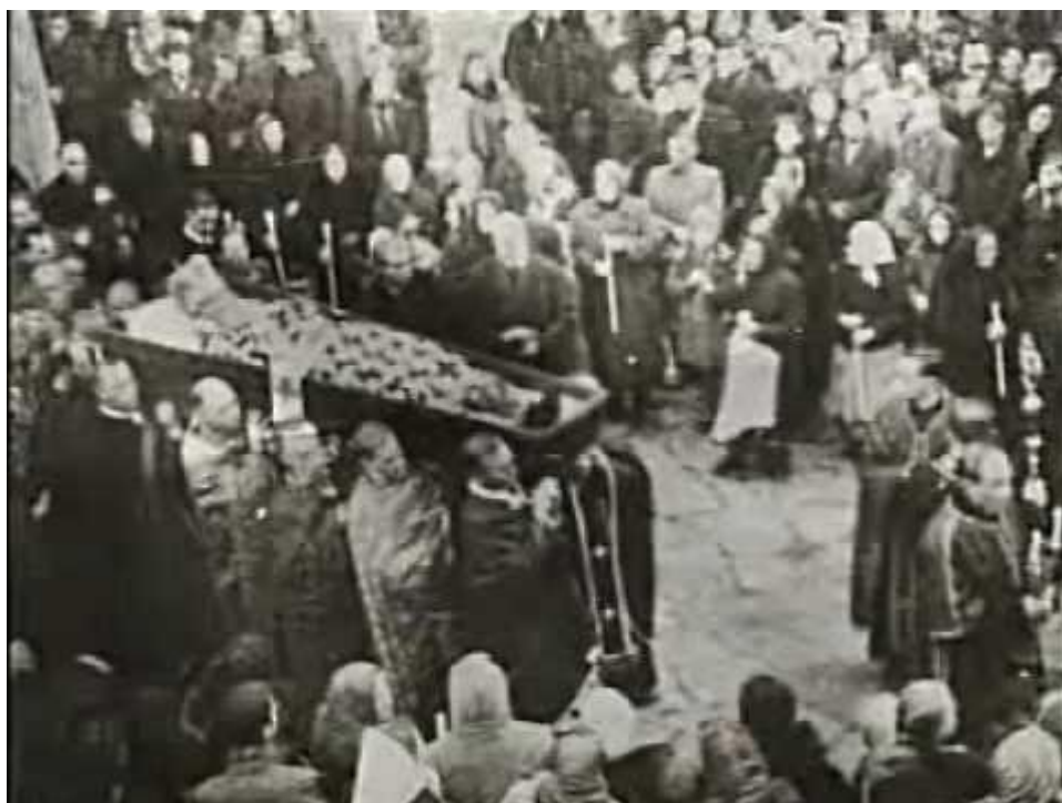
Похорон митрополита Андрея Шептицького

У липні 1944 року друга більшовицька окупація докотилася до Західної України. На той час митрополит Андрей Шептицький багато хворів, майже не покидав своєї резиденції в Соборі Святого Юра. Хоча ще до приходу радянських військ у Східну Галичину за кожним кроком митрополита уважно стежили агенти НКВС-МДБ, але навіть комуністичне керівництво не наважувалося знищувати Греко-Католицьку Церкву при живому Шептицькому. Занадто значним був його авторитет серед місцевої еліти та пересічних громадян. Але Великий Митрополит, як величали Шептицького в народі, знав, що його церкву чекають важкі часи. Доказом такого твердження є спогади очевидців останніх годин його життя.