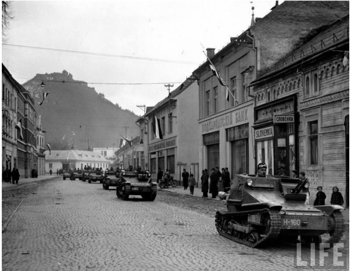
Угорська окупація Карпатської України

владі й підняла дух краян. Йдеться про вивішування синьо-жовтого національного прапора на Замковій горі в Хусті та встановлення дубового хреста на могилі січовиків на Красному полі. Ця акція була приурочена до другої річниці проголошення незалежної Карпатської України 15 березня 1941 року.