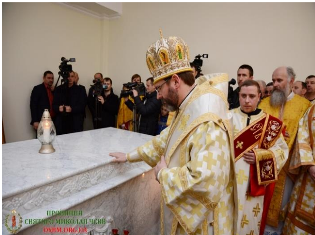
Перепоховання єпископа Івана Маргітича

Народним єпископом. Він навіть у кращі світи від нас відійшов так, як це личить духовному лідеру – під час Служби Божої у с. Пилипець на Міжгірщині.