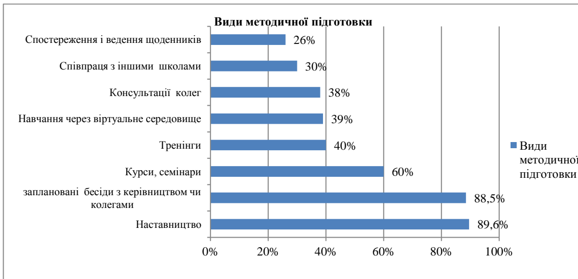
Рис. 1. Види методичної підготовки молодих вчителів закладів середньої освіти у європейських країнах.

У деяких країнах етап впровадження обмежується наставництвом. Участь наставників у програмі на початку педагогічної кар'єри молодого фахівця підвищує якість педагогічної освіти і педагогічної практики.