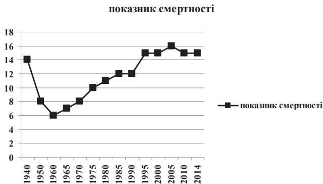
Рис. 1. Динаміка показника смертності населення України за 1940—2014 рр. (За даними державної служби статистики України)