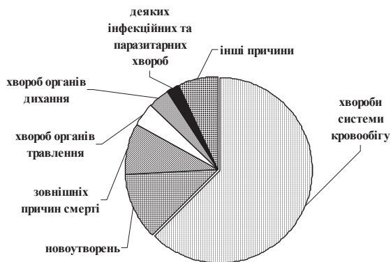
Рис. 3. Структура причин смертності українців працездатного віку (За даними державної служби статистики України)

частіше, ніж їхні ровесники в містах, наголосили у відомстві [6].