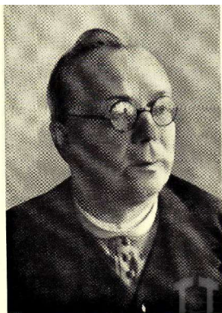
Августин Волошин (1874–1945)

Августин Волошин – громадсько-політичний, культурний, релігійний діяч Закарпаття, депутат чехословацького парламенту (1925–1929), лідер Християнсько-народної партії (1925–1938), прем'єр-міністр Карпатської України (1938–1939), депутат Союму і президент Карпатської України (1939). Основні праці: «Причини упадка народа нашего» (1911), «Ко вопросу політичної консолідації» (1923), «Нинішнє політичне положення Подкарпатської Русі» (1923), «Промова посла Авг. Волошина» (1929), «Наш націоналізм» (1935), «Початки національного пробудження на Підкарпатській Русі» (1936), «Якої автономії домагаємося» (1938), «Маніфест Уряду Карпатської України до всіх громадян Карпатської України» (1938) та ін.