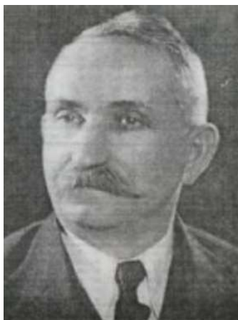
Михайло Бращайко (1883–1963)

Брати Михайло і Юлій Бращайки – громадсько-політичні та культурно-освітні діячі Закарпаття яскраво вираженої української орієнтації. Вони стали свідками складних суспільно-політичних подій у регіоні в першій половині ХХ століття, які залишили значний відбиток на їхній долі. Тоді процес національного самоусвідомлення місцевого населення Закарпаття вже набував високого рівня; воно пробудилося до державно-політичного життя і почало утверджувати, зважаючи на можливості, проукраїнську орієнтацію. Бращайки, які походили з родини греко-католицького церковного учителя, отримали хорошу освіту Клузьському, Віденському, Будапештському університетах, ставши фахівцями-правниками, й активно залучилися до політичного розвитку Закарпаття у міжвоєнний період.