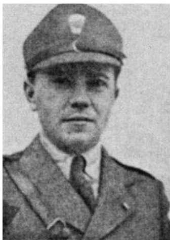
Іван Рогач (1913–1942)

До останнього дня свого життя Росоха залишився вірним ідеалам національної державності, які він виборював у часи Карпатської України.