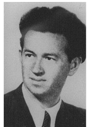
Степан Росоха (1908–1986)

Серед них одне із провідних місць належить Степану Рососі – громадсько-політичному та культурно-освітньому діячеві, одному із лідерів студентського та націоналістичного руху закарпатців, голові пропагандистського сектору езекутиви ОУН на Закарпатті (1932–1939), культурно-освітньому референту «Карпатської Січі» (1938–1939), депутату і заступнику голови Сойму Карпатської України (1939), журналістові, видавцю і редакторові журналів «Відродження» (1926–1930) та «Пробоем» (1934–1940). Його перу належать найвідоміші публікації про національну боротьбу молодії держави. Основні праці: «Народження держави» (1939), збірник «Карпатська Україна в боротьбі» (1939), «The First Diet of Carpatho-Ukraine» (1939), «Августин Волошин і Карпатська Україна» (1940), «Сойм Карпатської України» (1949), «Карпатська Січ» (1953) та ін.