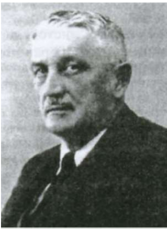
Юлій Брацайко (1875–1955)

Його політичні погляди лягли в основу перших державних законів Карпатської України, оскільки як знаному правнику йому довірили написати проект закону (частина I) про державний устрій (республіка), назву (Карпатська Україна), державну мову (українська), прапор (синьо-жовтий), герб (тризуб) і гімн («Ще не вмерла Україна...») Карпатської України, який був одногосно прийнятий першим українським парламентом у Закарпатті 15.03.1939 р., а також є автором аналітичної доповіді про стан судочинства в Закарпатській Україні.