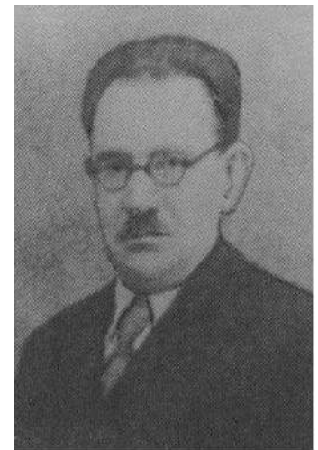
Федір Ревай (1890–1945)

Його політична думка, на відміну від більшості проукраїнських політиків стар-