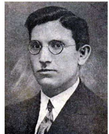
Юліан Ревай (1899–1979)

Як і брат Федір, у юному віці він залучився до громадсько-політичної діяльності, зокрема до соціал-демократичного руху, став співзасновником у Мукачеві Соціал-де-