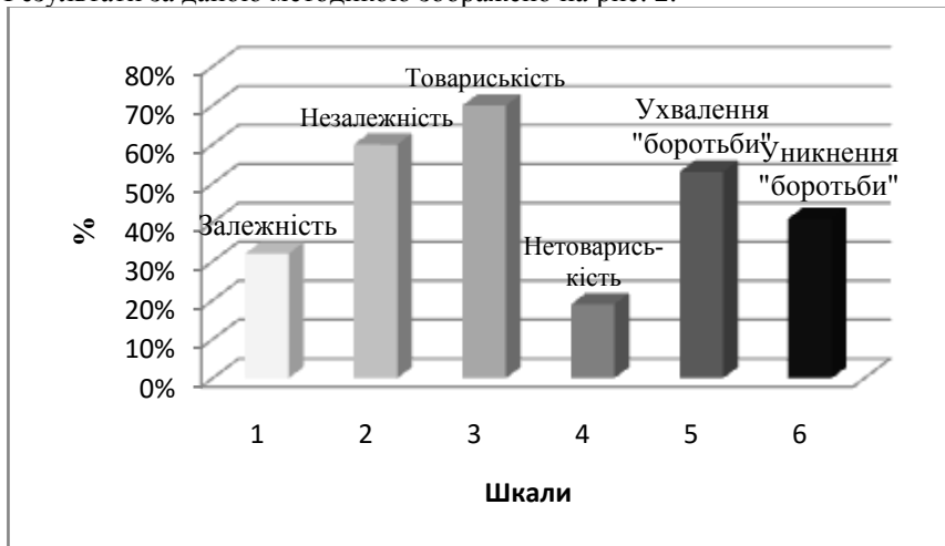
Рис. 2. Середні показники групи досліджуваних за методикою «Q-сортування» В. Стефансона у відсотковому значенні

Результати за даною методикою зображено на рис. 2.