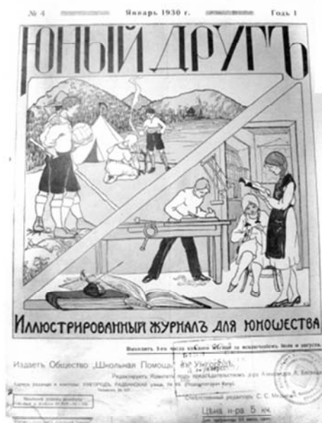
Рис. 12. «Юный другъ», 1930 г., январь, годъ I, № 4.