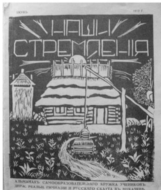
Рис. 13. «Наши стремления», 1932 г., июнь.

Часті, а подеколи принципові зміни у дизайні були характерною рисою молодіжних часописів не лише 1919-1944 рр., а й в інші періоди. На сторінках закарпатських молодіжних та дитячих видань можна виявити як роботи, виконані у наївній манері (зокрема, ранній твір Ф.Манайла), так і високохудожні твори М.Михалевича, Й.Бокшая. Кардинально різними є і стилістичні прояви: від абстрактного