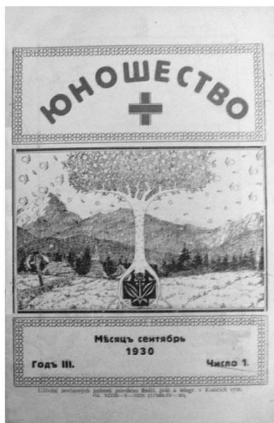
Рис. 2. «Юношество» 1930 г., сентябрь, годъ III, число 1.

«Молодая Русь» – «періодическій журнал общества карпаторусскихъ студентовъ «Возрожденіе» въ Прагѣ». На візуальному рівні у цьому часописі немає яскраво виражених типологічних ознак. Проаналізуємо три відмінні зразки оформлення обкладинки цього видання: 1930 року (два різних приклади) і 1931 року. При створенні обкладинки 1930 р. (№ 2) застосовано шрифтовий тип оформлення із використанням символіки краю – герба (для назви видання обрано шрифт в'язь) (Рис. 3), у