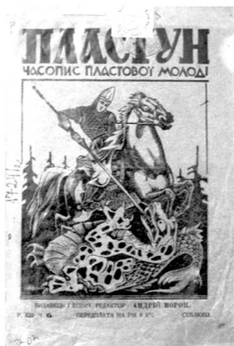
Рис. 9. «Пластун», 1935 г., червень, 1, рік XIII, число 6.

«У різних суспільствах та культурах, у різних народів «образ» ворога набуває деяких загальних рис, – пише науковець І. Гасанов. – Причини й обставини конфліктів та війн різні, але протягом історії існує усталений набір зображення ворога – певний «архетип» ворога, який складається, як мозаїка, з частин. Ворог