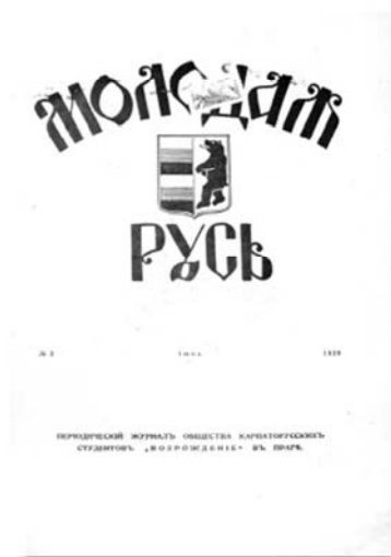
Рис. 3. «Молодая Русь», 1930 г., июнь, № 2.