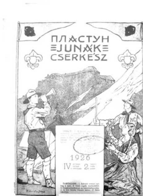
Рис. 6. «Пластун», 1926 г., річник IV, число 2.