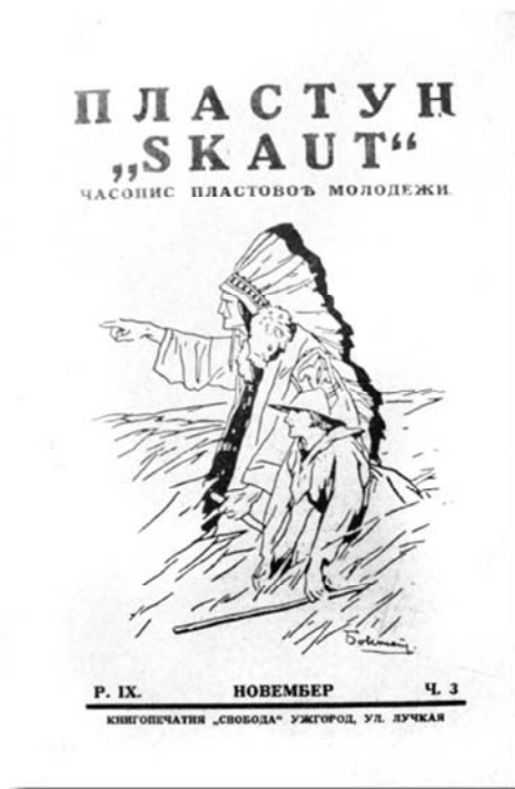
Рис. 7. «Пластун», 1930 г., новембер, рік IX, число 3.