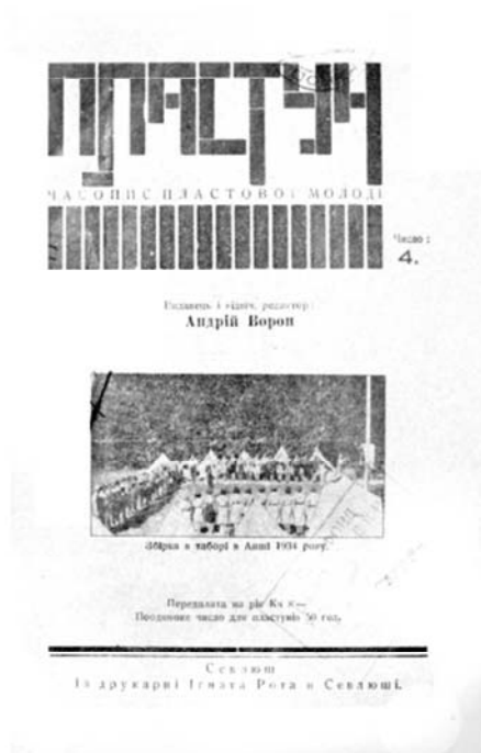
Рис. 8. «Пластун», 1935 г., квітень, 1, рік XIII, число 4.