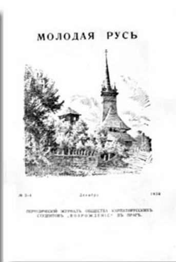
Рис. 4. «Молодая Русь», 1930 г., декабрь, № 3-4.