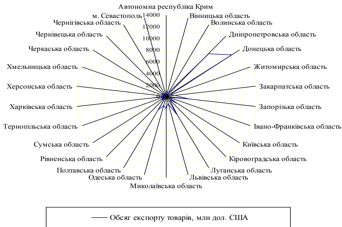
Рис.2. Обсяг експорту товарів регіонами України 2013 році [6]

Загальний обсяг експорту товарів із України у 2003 році становив 23066,8 млн дол. США [6], а у 2013 році – 63320,7 млн дол. США. Найбільш високий рівень експорту товарів у 2003 році спостерігався у Донецькій області – 4960,3 млн. дол. США, це становило 21,50% від загального обсягу експорту України. Найнижчий рівень цього показника у 2003 році спостерігався у м. Севастополь – 52,7 млн дол. США, це лише 0,23% від загального обсягу експорту України. У Закарпатській області цей показник у 2003 році становив 414,6 млн дол. США, а це – 1,80 % від загального обсягу експорту товарів в Україну.