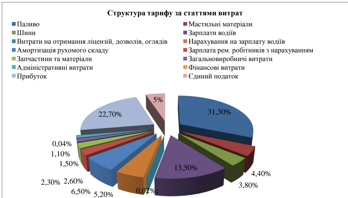
Рис. 1. Структура тарифу за статтями витрат