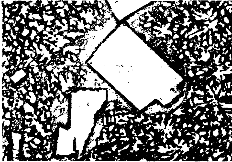
Рис.2. Мікроструктура одного з досліджених типів карбідів [4]: дрібні глобулярної форми - W_2C , великі багатогранної форми - WC (x 300).