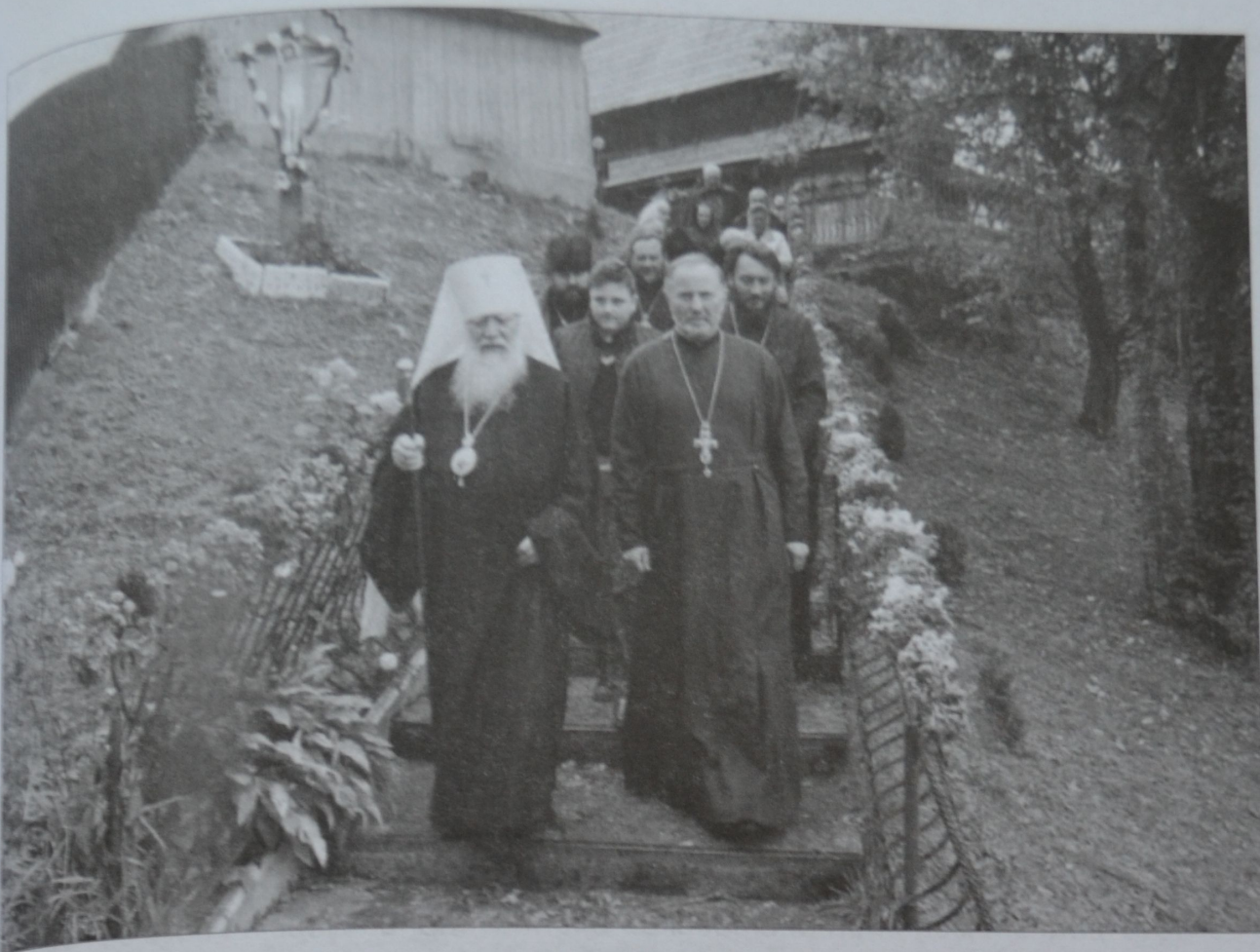
Високопреосвященніший Марк, митрополит Хустський і Виноградівський, з прихожанами Михайлівської церкви у Негрівці після служби Божої в храмі 11 жовтня 2015 р.

19 травня 2013 року у Негрівці владика Мукачівської греко-католицької єпархії освятив новий дерев'яний храм та дзвінницю у формі брами до церковного подвір'я.