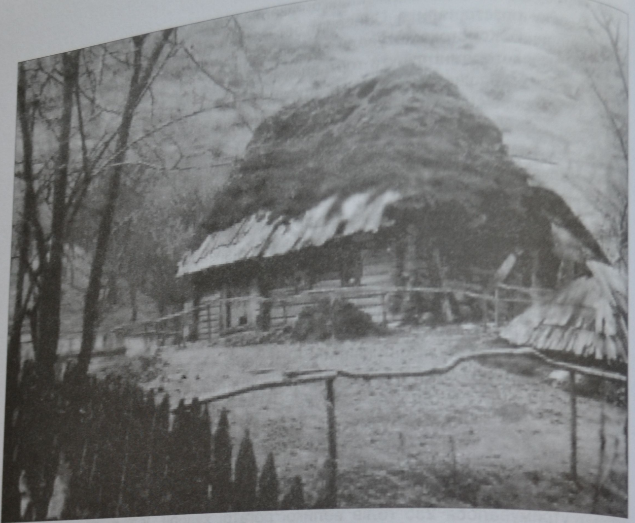
Остання солом'яна хата в Негрівці. Кінець 1960-х років

Звичайно, більшість продуктів харчування селяни мали із своєї ділянки, із свого малого господарства – картоплю, молоко, курячі яйця, сало, м'ясо, овечий сир... Овець тримали і для вовни, з якої виготовляли рукавиці, капці, светри, ліжники-покрівці.