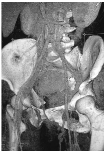
Рис. 1. МСКТ із контрастуванням. Оклюзія глибокої вени лівої н.к. на рівні гирла, оварікоцеле, відтік крові від нижньої кінцівки по лівій яєчниковій, нирковій вені та варикозних колатеральних пубікальних венах.