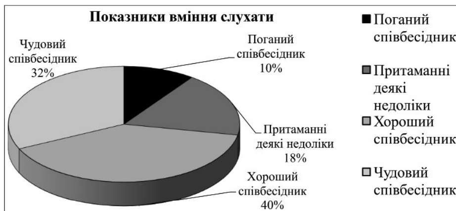
Рис. 2. Особливості прояву вміння слухати майбутніх соціальних працівників.

За методикою «Вивчення рівня комунікативного контролю» (М.Шнайдер) було з'ясовано, що більша частина досліджуваних має високий рівень комунікативного контролю (58%), що говорить про вміння постійно стежити за собою, керувати вираженням своїх емоцій. Такі люди легко входять в будь-яку роль, гнучко реагують на зміну ситуації, невимусовно себе почувають та здатні передбачити враження, яке справляють на оточуючих. (рис.2)