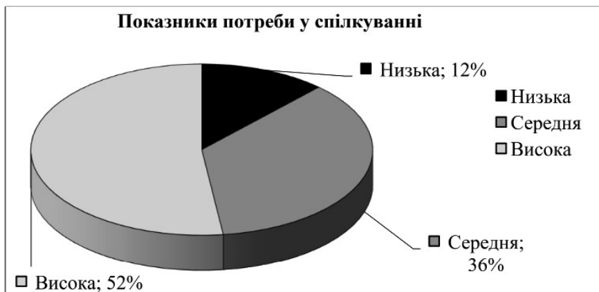
Рис. 1. Особливості прояву потреби у спілкуванні майбутніх соціальних працівників.

Відповідно до отриманих даних за методикою «Діагностика потреби у спілкуванні» (за Ю.Орловим) було з'ясовано, що потреба у спілкуванні у майбутніх соціальних працівників у більшості має високий рівень (52%), середній (36%) та у значної меншості низький (12%), що говорить про їх бажання вступати у взаємодію з іншими людьми, направленість на комунікацію, зацікавленість у передачі та обміні інформацією та емоціями (рис. 1).