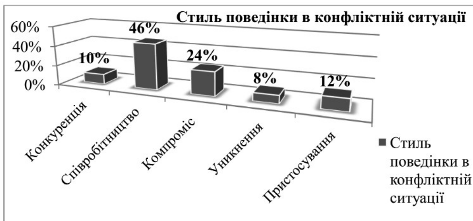
Рис.5. Особливості прояву стилів поведінки в конфліктній ситуації майбутніх соціальних працівників.