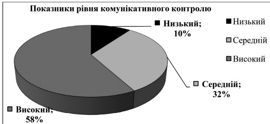
Рис. 3. Особливості прояву рівня комунікативного контролю майбутніх соціальних працівників.

розкутість, поведінка таких осіб мало піддається змінам в залежності від ситуації спілкування і не завжди співвідноситься з поведінкою інших людей. Їхня поведінка рівномірна (однакова) незалежно від ситуації та вони здатні до щирого розкриття в спілкуванні, надмірну пряmolінійність (рис.3).