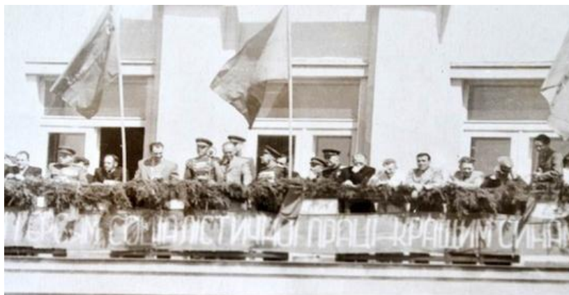
Першотравнева демонстрація в Ужгороді, 1946 р.

Збереглися матеріали про підготовку й проведення першотравневих свят, Дня друку, Дня перемоги в 1950 році [12]. 1 травня проводились окружні збори завідувачів клубів, бібліотек, керівників художньої самодіяльності. До цього в рамках місячника ремонту культосвітніх закладів у клубах і бібліотеках робили внутрішню і зовнішню побілку, прибирали прилеглу територію. Культурно-освітні заклади оформляли портретами керівників комуністичної партії і радянського уряду. У колгоспах, бригадах, радгоспах, МТС, клубах і бібліотеках читали лекції за тематикою обласного лекційного бюро, проводили бесіди за матеріалами газет і журналів до Дня 1 травня, Дня друку, Дня перемоги,