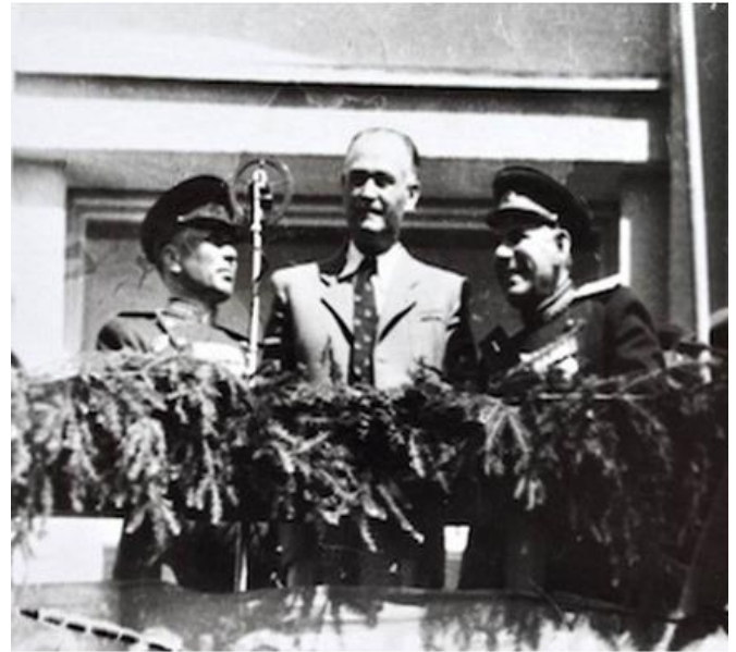
Першотравнева демонстрація в Ужгороді, 1946 р.

Цей парк культури і відпочинку відкрили за вказівкою з Києва спеціально до «першотравневих свят». Для оформлення міста першотравневими гаслами, портретами і плакатами витратили 102150 крб. Було закуплено портрети різних розмірів членів політбюро ЦК ВКП (б) і РНК СРСР, керівників УРСР, маршалів СРСР, героїв СРСР, героїв Соціалістичної праці, партизанів і «передових людей Закарпаття» [11].