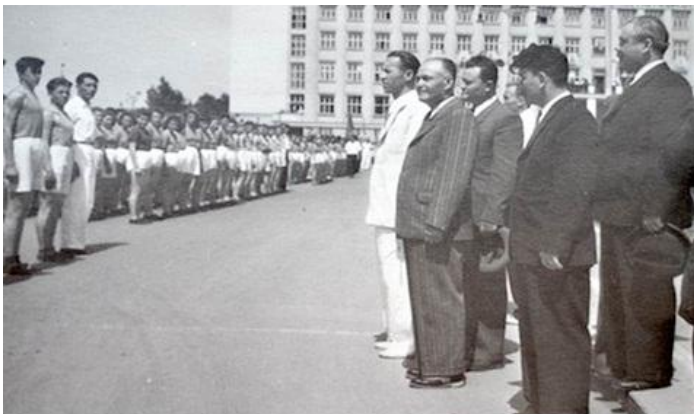
Перший секретар обкому партії та голова облвиконкому І. Туряниця на спортивних заходах. Ужгород, 1947 р.

Організація радянських бібліотек на Закарпатті передбачала сувору цензуру наявних книгозбірень [28]. З довідки «Про стан бібліотечної роботи Закарпатської області» від 20 листопада 1946 р. дізнаємось про намір «прискорити перевірку, зокрема мадярською та чеською мовами з тим, щоб в найближчий час населення, яке володіє цими мовами, змогло користуватися бібліотеками», а також про облік фондів бібліотек монастирів і музеїв, ізолювання сумнівної та вилученої літератури [29]. Дозволялося читати лише літературу, перевірену комуністичними цензорами.