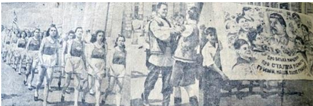
Святкування 1 травня 1946 р. в Ужгороді(Закарпатська правда.4 травня 1946)

Із невідомих причин технікум перенесли у Хуст (пізніше в Ужгород). Новостворений навчальний заклад мав украй убогі умови для навчання і проживання студентів. Через відсутність приміщень розпочали навчання аж навесні 1947 року. За планом прийому передбачалося 120 студентів, розпочала навчання лише одна група бібліотекарів у складі 36 осіб [5].