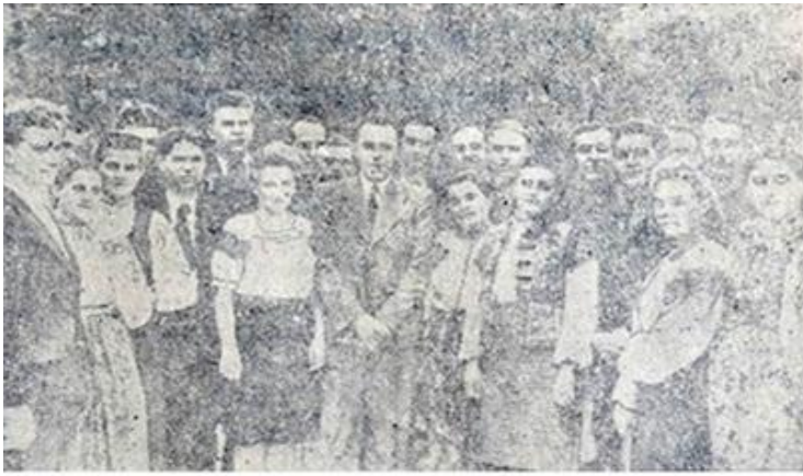
Група учасників художньої самодіяльності Закарпатської області, які побували на екскурсії у Харкові, Сталіно, Маріуполі, Запоріжжі, Дніпропетровську і Каневі. (Закарпатська правда. 13 вересня 1946)

У роботі музеїв ідеологічна складова теж була на першому місці. На 1950 р. в області діяло два музеї – Ужгородський історико-краєзнавчий та Мукачівський історико-краєзнавчий. Ужгородський мав три відділи: природи, історії дорадянського періоду, історії радянського періоду. Протягом 1949 р. музей відвідало 11403 особи. Була відкрита виставка до 70-річчя «великого вождя» Й. Сталіна [40]. У 1949 р. значно поповнилися фонди музею. Проведено 104 експедиції, виготовлено 25 нових опудал, зібрано понад 500 археологічних старожитностей, 600 отримано від Мукачівського музею, зібрано близько 300 мінералів і комах. Було оброблено підйомний археологічний матеріал з околиць Ужгородського замку і Радванки. Почалися розкопки всередині укріплень замку, здійснені археологічні розвідки на околицях Мукачева і Сваляви. Співробітники брали участь і в розкопках Інституту археології Українців с.Білки.