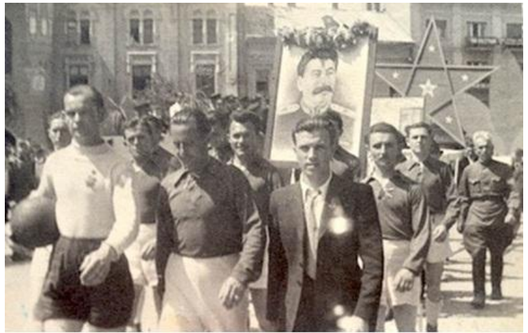
Першотравнева демонстрація в Ужгороді, 1946 р.

На початок 1950 р. мережа клубних закладів радянського зразка в області була сформована. Діяли обласний будинок народної творчості, 13 окружних і міський будинок культури, 420 сільських клубів, 110 сільських хат-читалень, колгоспний клуб, клуби товариств «УТОС», «УТОГ», 54 профспілкові клуби, 94 червоні кутки [21]. На місці колишніх осередків «Просвіти», товариства ім. Духновича, закритих церков була створена масштабна мережа сільських клубів, що об'єднували під одним дахом бібліотеку і кінотеатральний зал для «комуністичного виховання людей», особливо молоді [22].