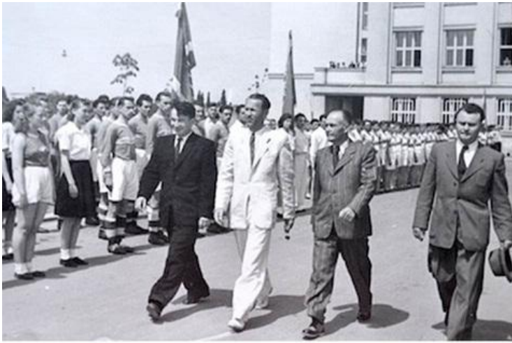
Перший секретар обкому партії та голова облвиконкому І. Туряниця на спортивних заходах. Ужгород, 1947 р.

Невицьке викликав на змагання клуб с. Кам'яниця. Змагання відбувалося за багатьма показниками – ремонт клубу, забезпечення обладнанням, створення драматичного, танцювального і фізкультурного гуртків, ліквідація неписьменності, облагородження території [24]. Змагалися культурно-освітні працівники Хустської округи із своїми колегами з м. Виноградів і с. Волове. Своім завданням культурно-освітні працівники Хустщини бачили мобілізацію селян на виконання п'ятирічки, на дострокове виконання плану здачі хліба, сіна, м'яса державі, боротися проти куркулів і фашистської агітації. У 1947 р. в Ужгородській округі змагалися клуби сіл Минай та Струмківка, в Хустській – клуби сіл Сокирниця та Олександрівка, відділи культосвітніх установ Іршавської та Хустської округ [25].