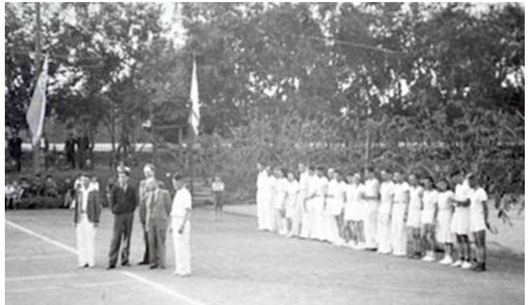
Перший секретар обкому партії та голова облвиконкому І. Туряниця на спортивних заходах. Ужгород, 1947 р. (Фонди ДАЗО)

Широкого поширення набуло соціалістичне змагання серед працівників культури. Уже 21 червня 1946 р. клуб с.