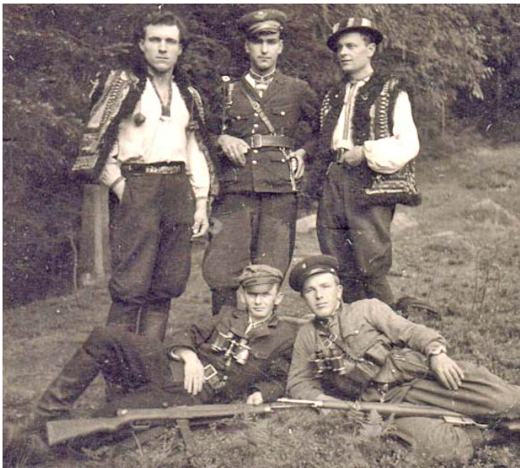
ОУНівці на привалі. URL: https://zak.depo.ua/ukr/zak/oun-upa-na-zakarpatti-pravda-yakazamovchuvayasa-09042015181500