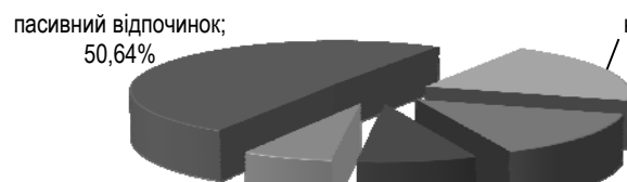
Рис. 3. Використання студентами вільного часу

Однак, 69,5 % студентів зазначили, що в середньому за хворобою у поточному році було пропущено 25 навчальних днів. Опитування також показало, що 50,64% респондентів віддають у вільний час перевагу пасивному відпочинку, що може свідчити про високий рівень щоденного розумового навантаження та низький рівень мотивації студентів до використання фізичної культури і спорту з метою зміцнення здоров'я та відновлення сил. Окрім того, 20,51 % осіб свій вільний час присвячують навчанню, 14,10 % студентів – працюють, тільки 8,33 % студентів займаються руховою активністю на дозвіллі та 6,41% респондентів вільний час використовують для інших занять (рис. 3).