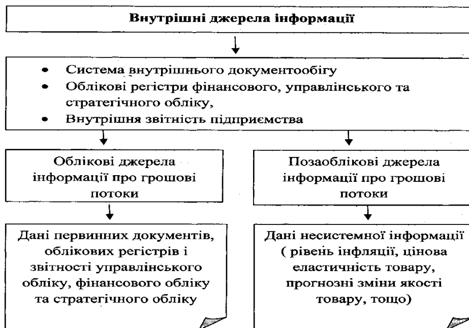
Рис. 3. Внутрішні джерела інформації

[ складено автором на основі джерела 17]