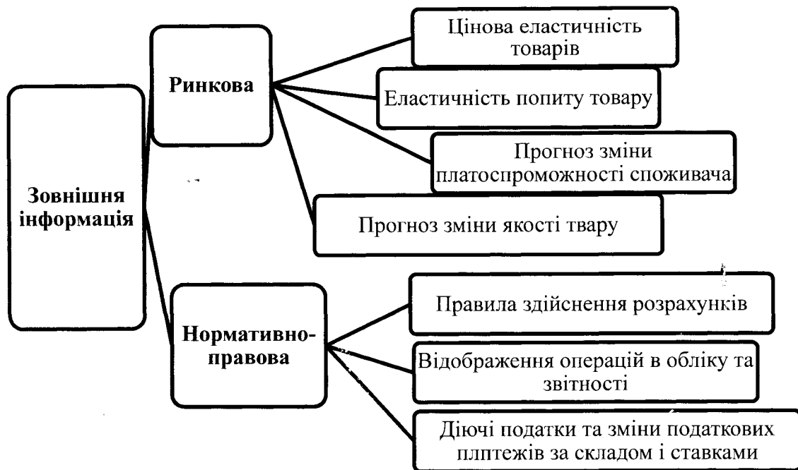
Рис. 2. Поділ зовнішньої інформації

[*складено автором на основі джерела 18]