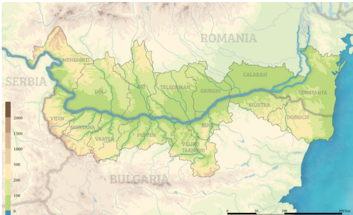
Рис. 1. Адміністративно-територіальні одиниці Програми INTERREG V-A Румунія-Болгарія в період 2014-2021 рр. Джерело: www.interregrogbg.eu/bg/programme/programme-general-data.html

Програма INTERREG V-A Румунія-Болгарія – це програма, що фінансується ЄС через Європейський фонд регіонального розвитку (ЄФРР), територіально охоплює 7 повітів у Румунії та 8 областей в Болгарії (рис.1), має на меті «розвиток прикордонної зони між двома країнами через фінансування спільних проєктів».