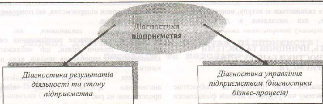
Рис. 2 Об'єкти діагностики підприємства

Зупинимося на структурі діагностики, а саме на діагностиці результатів діяльності та стану підприємства. Фінансовий інструментарій цієї частини діагностики дуже великий, він містить у собі велику кількість фінансових показників (коефіцієнтів), що найчастіше дублюють один одного, і необхідність використання тих чи інших коефіцієнтів є не завжди очевидною. Доцільно сформулювати третє положення фінансової діагностики у вигляді принципу розумної достатності використання методів фінансового аналізу. Суть принципу надзвичайно проста: для цілей діагностики варто використовувати тільки ті показники, що є інформаційною основою для прийняття управлінських рішень. Практична користь цього принципу є очевидною з огляду на те, що на багатьох підприємствах найчастіше використовується велика кількість фінансових коефіцієнтів, перелік яких визначає фінансовий директор.