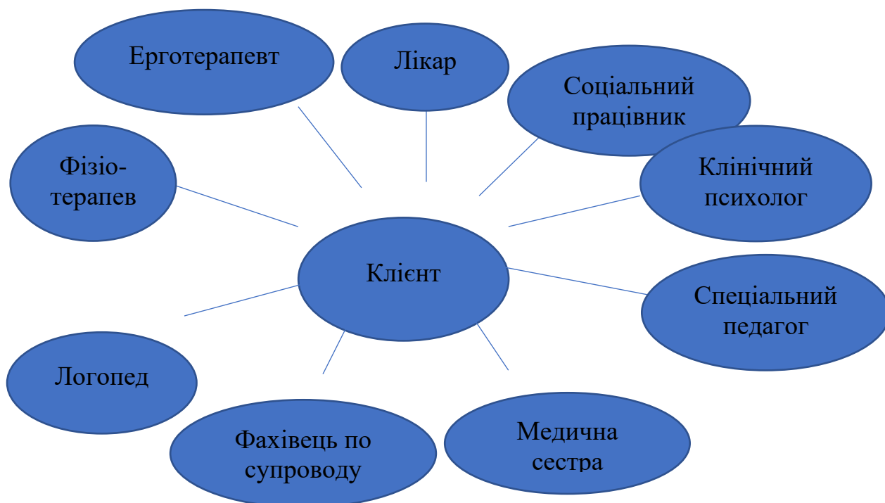
Рис.1. Склад мультидисциплінарної команди

З цією метою на базі УжНУ рекомендовано створити сучасний навчально-практичний ефективний структурний підрозділ, який провадить підготовку всіх членів мультидисциплінарної команди надання медико-соціальних послуг особам, які їх потребують; якісно готує фахівців відповідно до кваліфікаційних вимог міжнародних фахових організацій в кількості необхідній для ефективного функціонування систем надання послуг в регіоні.