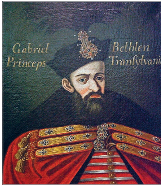
Bethlen Gábor arcképe

A kultúrréteg vastagsága a kutatott helyszíneken, az adott mai járósinttől számítva elérte az 1,5 métert, maga az alapozás 1,35 méterre mélyült a talajba. A felső 50 cm-es feltöltésben 20. századi leletanyag