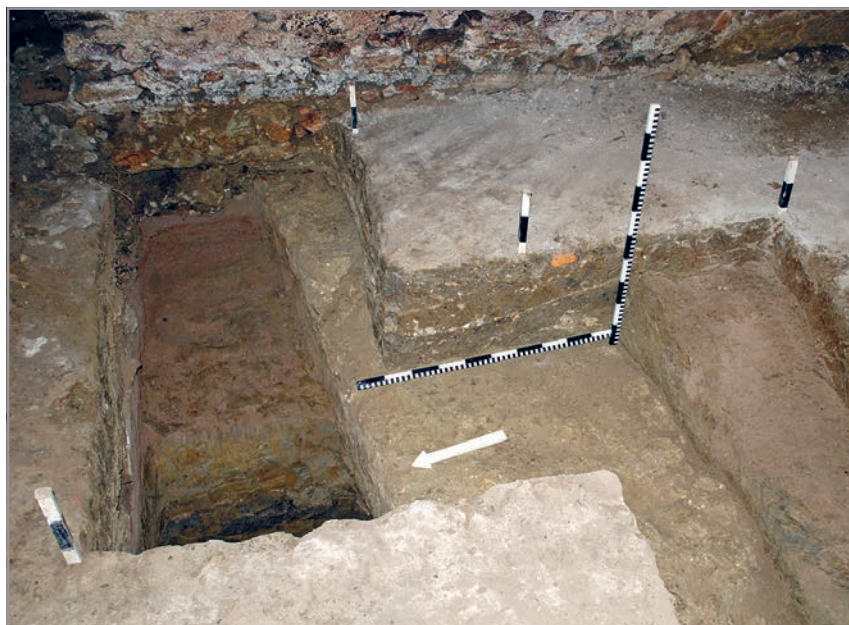
A kastély pincéje: az 1. kutatóárkok rétegei

volt jelen, alatta viszont már 15–17. századi leletek kezdődtek: kerámiatöredékek, két pénzérme. Az utóbbiak közül az egyik II. Miksa 1576-os kibocsátású verete, a másik pedig egy nagyon rossz állapotban fennmaradt rézpénz. A körirat részlete alapján a 15. század közepére keltezhető.