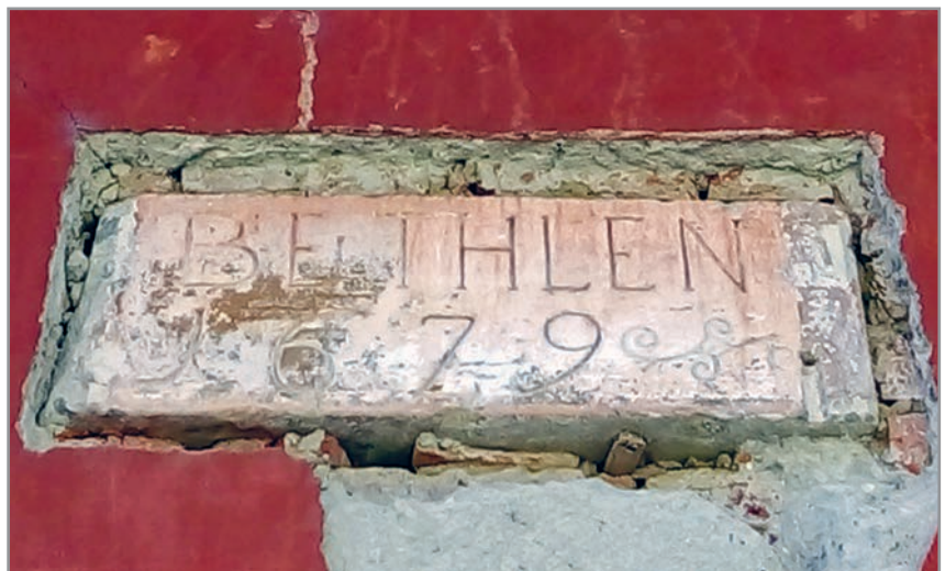
Kőbe faragott építési felirat a kastély északi homlokzatán