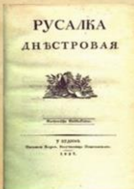
Обкладинка «Русалки Дністрової»