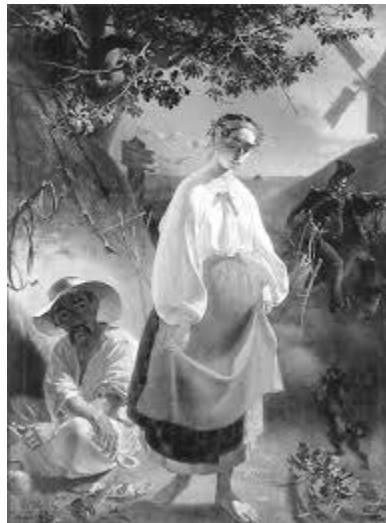
Катерина. Худ.Тарас Шевченко