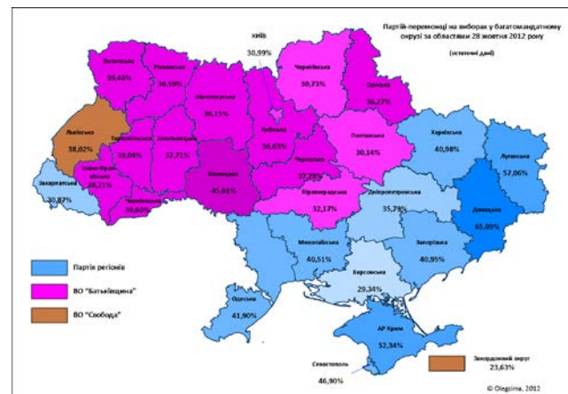
Obrázok č. 3: Regionálne rozloženie volebnej podpory Strany regiónov, Všeukrajinské združenie „Baťkivščina“ a „Svoboda“ v parlamentných voľbách v roku 2012.

Posledné parlamentné voľby v roku 2012 vo všeobecnosti potvrdili regionálne rozdelenie volebnej mapy Ukrajiny, ktorá sa vytvorila v minulých rokoch (Obrázok č. 3). Výnimkou sa stala Zakarpatská oblasť, kde väčšinu hlasov získala Strana regiónov. Podľa straníckych zoznamov získali opozičné strany (VZ „Baťkivščina“ a „Svoboda“) väčšinu hlasov v 15 regiónoch, ale podľa množstva mandátov, v súlade so straníckymi zoznamami a väčšinovými obvody, zvíťazila Strana regiónov.