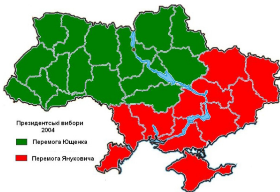
Obrázok č. 1: Regionálne rozloženie volebnej podpory V. Juščenka a V. Janukovyča v prezidentských voľbách v roku 2004.

Na základe výsledkov prezidentských volieb v roku 2004 bola Ukrajina rozdelená do dvoch častí. Volebná mapa z roku 2004 dosvedčila víťazstvo Viktora Juščenka v západných a centrálnych oblastiach, a Viktora Janukovyča – na východe a juhu krajiny (Obrázok č. 1).