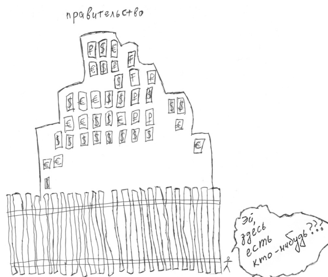
Рисунок 1 Образ правительства РФ

Кроме того, налицо рассогласование образов реального и идеального правительств. Так, изобразив правительство в виде «дерева с крепкими корнями, которое должно приносить плоды в виде решений» (см. рис. 2 ), респондент пояснил, что у реального правительства РФ, видимо, «гнилые корни».