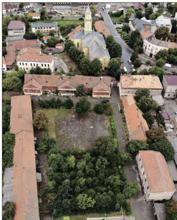
Рис. 1. Загальний вигляд на палацовий комплекс Бетлена-Ракоці зі сходу

У конкретизації розташування домініканського монастиря можуть допомогти результати археологічних досліджень саме навколо римо-католицької церкви. На жаль, досі такі цілеспрямовані роботи не проводи-