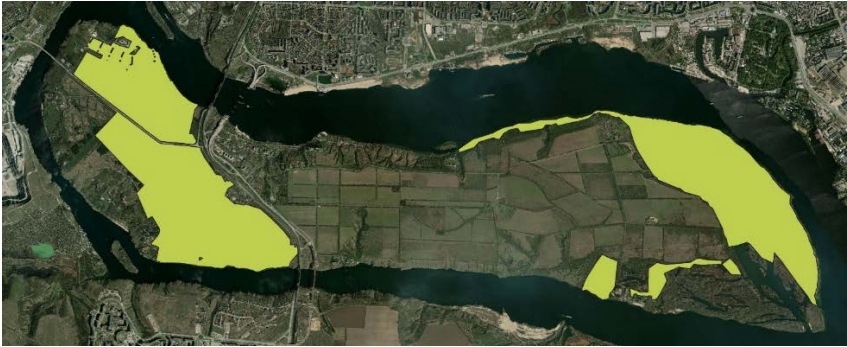
Рис. 1. Межі Державного лісового фонду на острові Хортиця