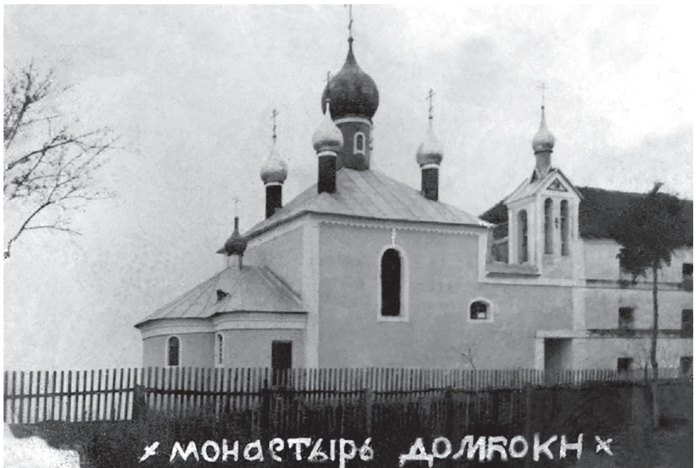
Іл. 2. Жіночий монастир у с. Домбоки на Мукачівщині. 1940-ві рр.