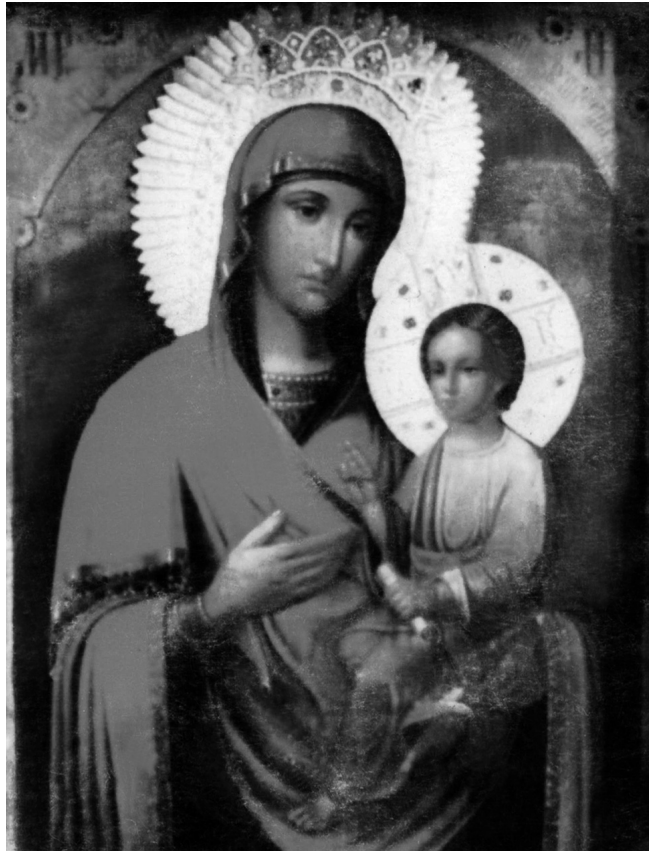
Іл. 3. Ікона «Скоропослушниця»