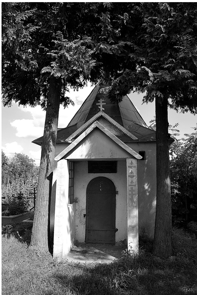
Іл. 6. Каплиця, де похована родина Карбованців

сувалися проти о. Іоанна. З огляду на певний брак документів і усних свідчень, вивчення життєвого шляху о. Іоанна Карбованця необхідно продовжувати.