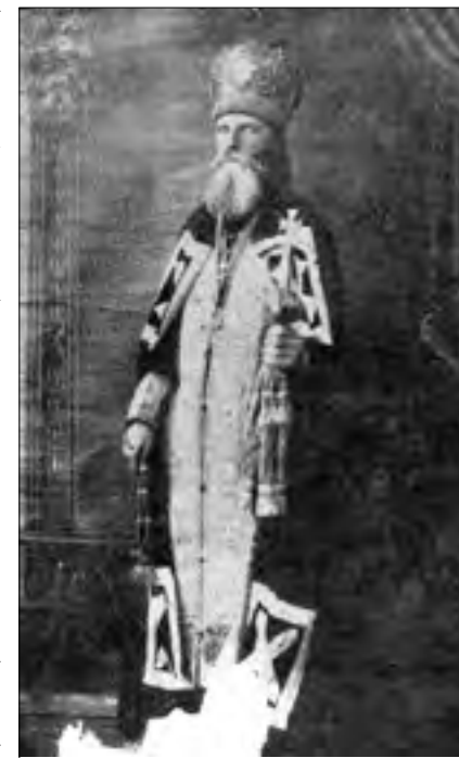
Архімандрит Алексій (Кабалюк), початок 1940-х рр.

У 1923 р. архімандрит Савватій (Врабец), голова чеської православної громади в Празі, започаткував гострий конфлікт між