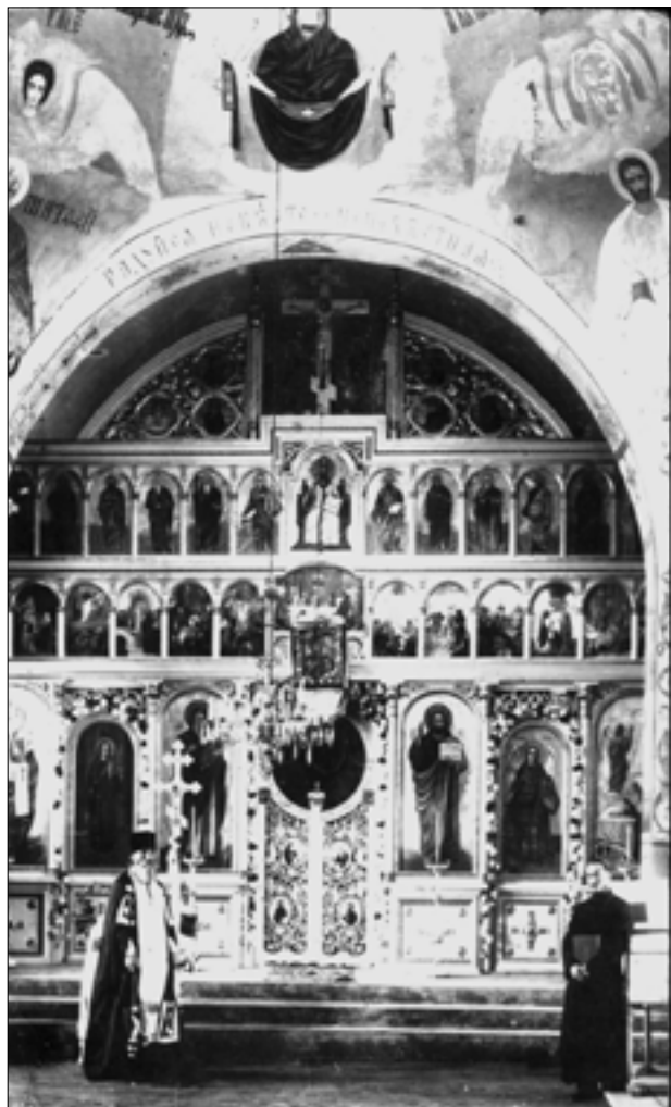
У храмі в м. Хуст, 1930-і рр.

Константинопольською та Сербською православними церквами, який увійшов в історію під назвою «Савватіївський розкол». На Закарпатті утворилися дві групи православних, одна з яких визнавала юрисдикцію Сербської церкви (40 священників), її