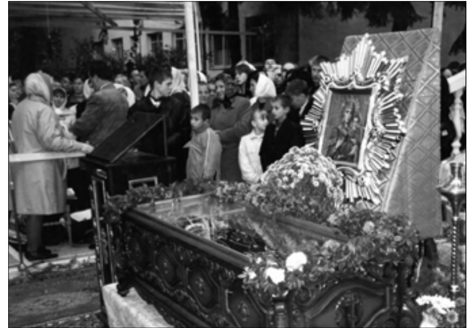
Канонізація преподобного Алексія (Кабалюка), 21 жовтня 2001 р.

Попри всі пережиті великі страждання й переслідування, архімандрит Алексій дожив до сімдесятирічного віку. Приймавши велику схиму, 2 грудня 1947 р. він помер у Домбокському монастирі. Звідти тіло подвижника було перевезено до Ізького монастиря, де поховано на братському цвинтарі.