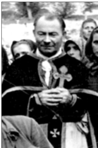
Отець Іоанн, 1960-ті рр.

на 10 років ув'язнення за звинуваченням у зраді угорській державі. З 27 жовтня 1944 р. до 29 квітня 1945 р. він перебував у концентраційному таборі Дахау в Німеччині 1 . Звільнений з ув'язнення американськими військами.