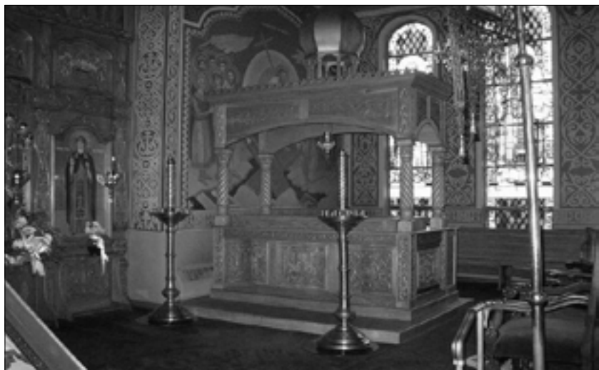
Нетлінні моці святого Алексія Товта знаходяться у храмі свт. Тихона Задонського, штат Пенсільванія

Кілька років тому він отримав золоту церковну корону від царя, яка була привезена сюди спеціальним посланцем. Це був суттєвий знак поваги, який був виявлений цьому з боку церковного керівництва в Росії... Олтар церкви Святої Марії, який оздоблений золотом, оцінюється в $ 5.000, був збудований Отцем Товтом на кошти настоятельки одного із великих монастирів в Росії.