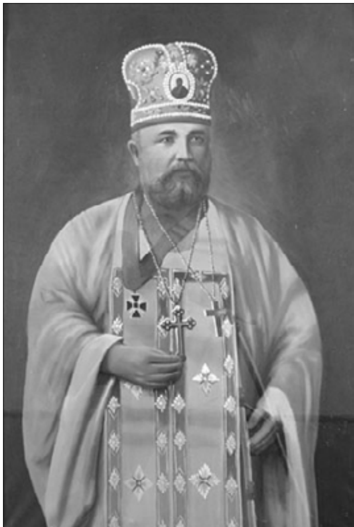
Портретне зображення протопресвітера Алексія Товта

Нью-Джерсі, але нічого не допомагало 1 . Повернувшись у Вількес-Барре о. Алексій був два місяці прикутий до ліжка. 7 травня (24 квітня за ст. ст.) 1909 р. відійшов у вічність.