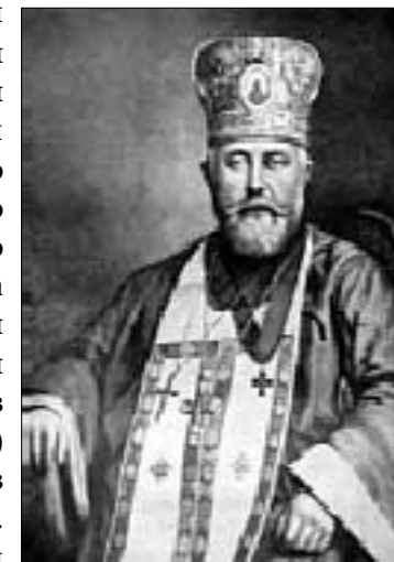
Протопресвітер Алексій Товт

У 1903 р. у зв'язку з 25-літтям пастирського служіння возведений у сан протоієрея та нагороджений митрою 1 . У 1905 р. виступив одним із ініціаторів створення «Руського Православного Кафолічеського Общества Взаимопомощи». За його участі була заснована газета «Свет» та інші видання і організації 2 . Завдяки місіонерським старанням о. Алексія у православ'я перейшло 17 приходів (близко 20 тис. населення в Америці) та багато тисяч греко-католиків в Угорській Русі та Східній Словаччині. Отець Алексій був також талановитим богословом-письменником. При житті він видав чотири книги, найбільш відома з них «Где искати правду?» і багато статей в журналах та газетах Америки.