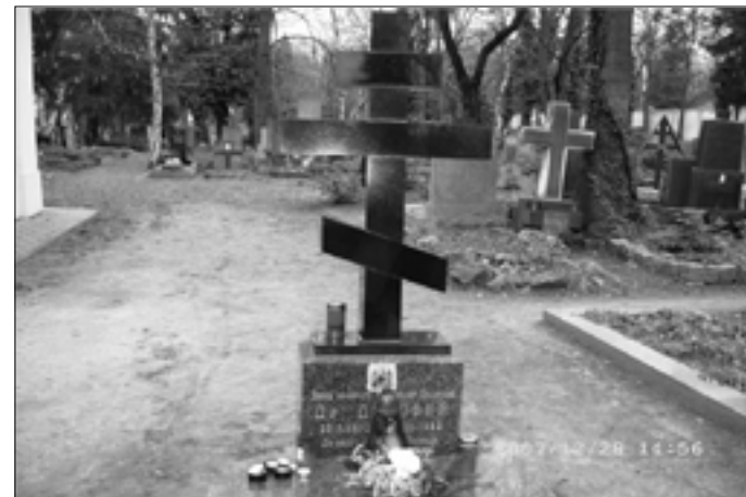
Могила митрополита Дорофея (Філіпа)

Помер 30 грудня 1999 р. Похований на Ольшанському кладовищі в Празі біля храму Успіння Пресвятої Богородиці 2 .