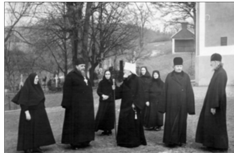
На кладовищі Свято-Миколаївського монастиря, 1964 р.

Патриарх Алексий принял Его Блаженство в своей московской резиденции. Встреча Глав двух Православных Церквей прошла в исключительно сердечной братской обстановке». Митрополит Дорофей взяв участь у святкуванні 20-річчя патріаршого служіння Патріарха Алексія I, відвідав Ленінград, де провів зустріч з Головою Відділу зовнішніх відносин Московського Патріархату митрополитом Ленінградським і Ладозьким Никодимом, відправив ряд богослужінь в храмах Москви, Ленінграду та Свято-Троїцькій Лаврі. Крім того, митрополит побував у стінах Московської та Ленінградської духовної академії та в Псковсько-Печерському чоловічому монастирі 1 .