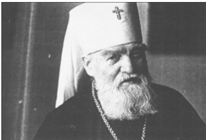
Одна з останніх фотографій митрополита Дорофея (Філіна), 20 листопада 1993 р.

Предстоятеля Церкви литургию. Молящиеся – православные и верующие инославных исповеданий – переполнили храм, Православное торжество вылилось в праздник христианского братства. По окончании Божественной литургии митрополит Дорофей произнес слово, проникнутое духом любви к пастве.