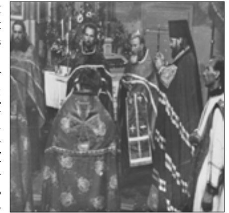
Єпископ Дорофей (Філін), у Мукачівському монастирі, 1955 р.

За інформацією часопису «Заповіт св. Кирила і Мефодія»: «Під час своєї архіпастирської служби на Пряшівській кафедрі владики Дорофей записав себе до сердець вірників своєї єпархії як відповідальний пастир та духовний отець, учитель віри, місіонер, котрий не будує православну Церкву на дипломатії та силі, спираючись у Мукачівському монастирі, 1955 р.