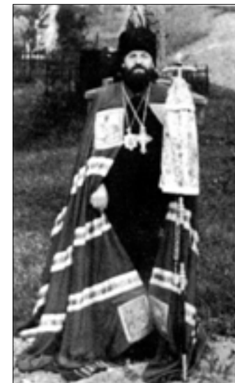
Єпископ Дорофей (Філін), 1955 р.