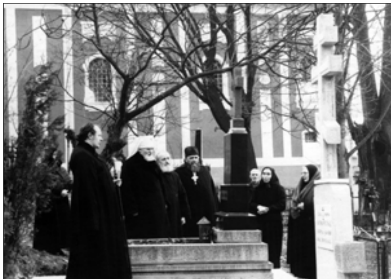
Під час візиту до Мукачівського Свято-Миколаївського монастиря, 1964 р.

25 жовтня 1964 р. в кафедральному храмі св. Кирила та Мефодія в Празі відбулася інтронізація митрополита Дорофея. У ній взяли участь вищезгадувані архієреї, духовенство та миряни 2 .