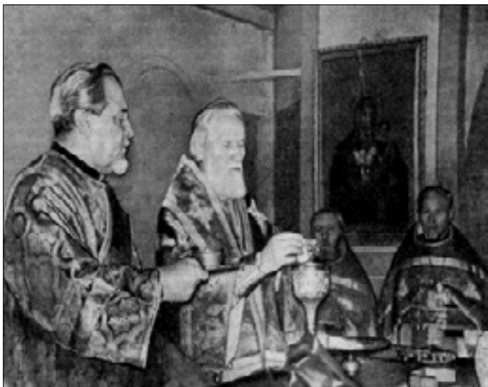
Архієпископ Кишинівський і Молдавський Іонафан зверхує Божественну Літургію в Феодоро-Тироновському кафедральному соборі в м. Кишиневі, 21 листопада 1983 р.

17 листопада 1983 р. нагороджений орденом св. князя Володимира 2-го ступеня 1 .