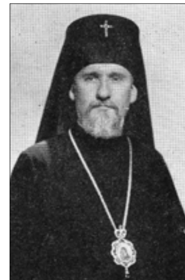
Іонафан, архієпископ Кишинівський і Молдавський

З 23 червня 1966 р. – тимчасово керуючий Берлінською епархією і виконуючий обов'язки Екзарха в Середній Європі. 7 липня 1966 р. призначений тимчасово керуючим Віденською епархією. З 7 жовтня 1967 р. – архієпископ Нью-Йоркський і Алеутський, Патріарший Екзарх в Північній і Південній Америці 2 . У 1968 р. був членом делегації РПЦ на IV Асамблеї Світової Ради церков. 20 березня 1969 р. включений в склад Комісії Священного Синоду по питаннях християнського об'єднання 3 .