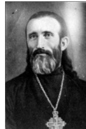
Архімандрит Амфілохій (Кемінь), 1930-і рр.