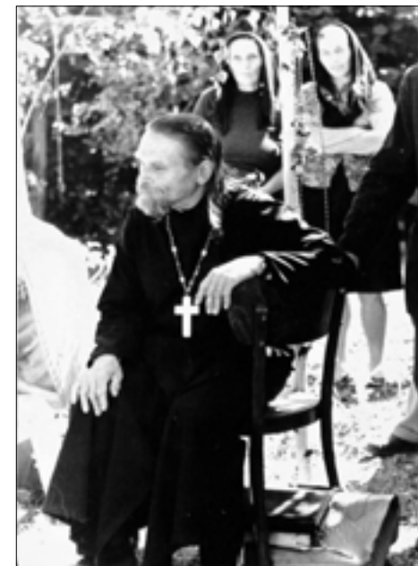
Серед прихожан, 1960-і рр.

Навколо гарна природа, ліси, чисте повітря... Є тут гарно, і якби сама природа відповідала на багато питань ігумена Ігнатія. Пахне тут духом вічності; кожний тут відчуває себе добре. Каплиця маленька, як ми вже говорили, але цього року була наповнена радістю, тому що отець ігумен її добудував. Присутніх було стільки, що не всі могли розміститися. Святу Літургію, таким чином, служили поряд з каплицею, де був підготовлений вівтар. Богослужіння почалося близько пів на десяту. Святу Літургію служив о. ігумен Ігнатій з духовенством з округу, прийшли і вірники з околиць.