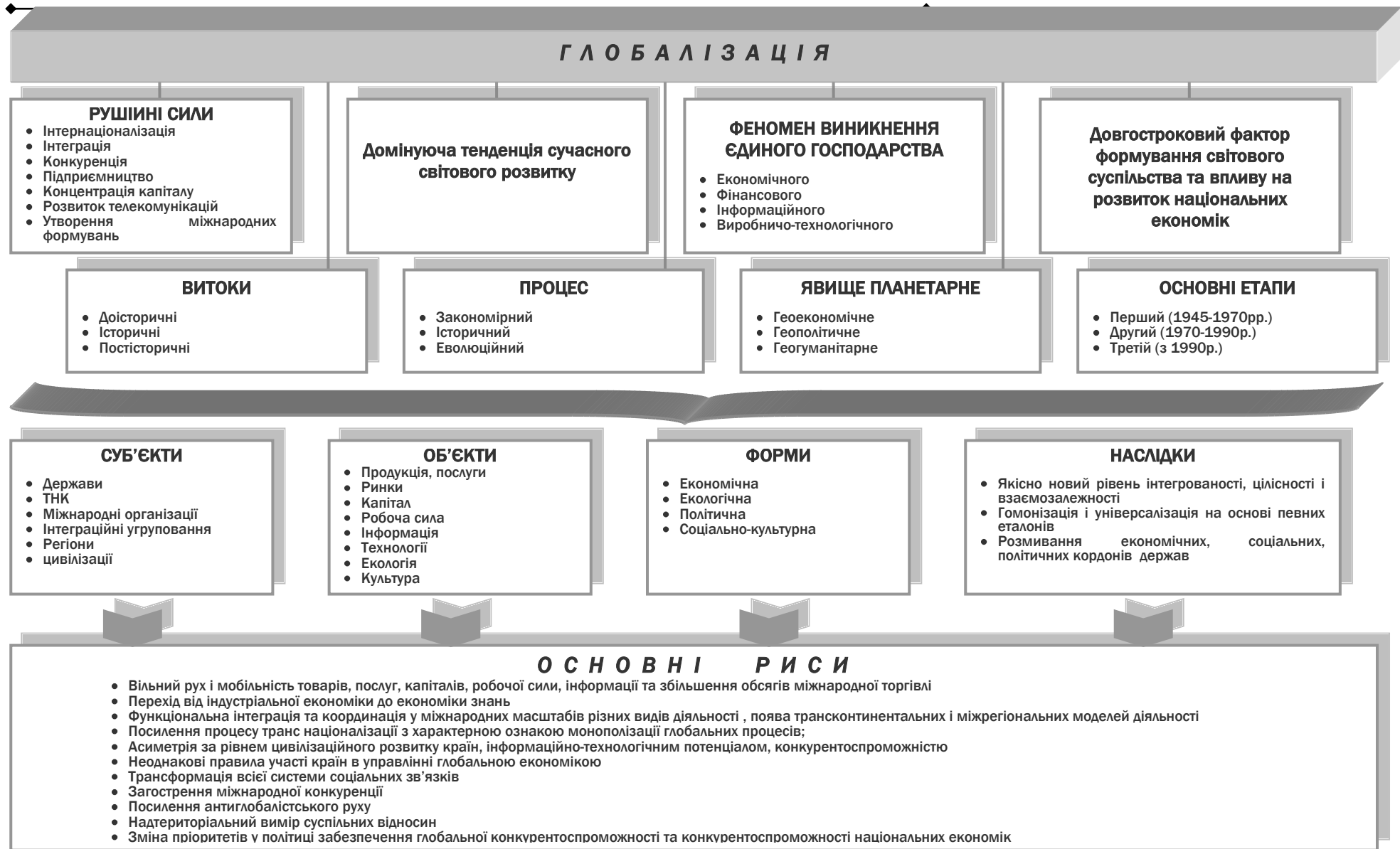
Рис. 3 Глобалізація: сутність, основні риси та рушійні сили [15, с.45-46]