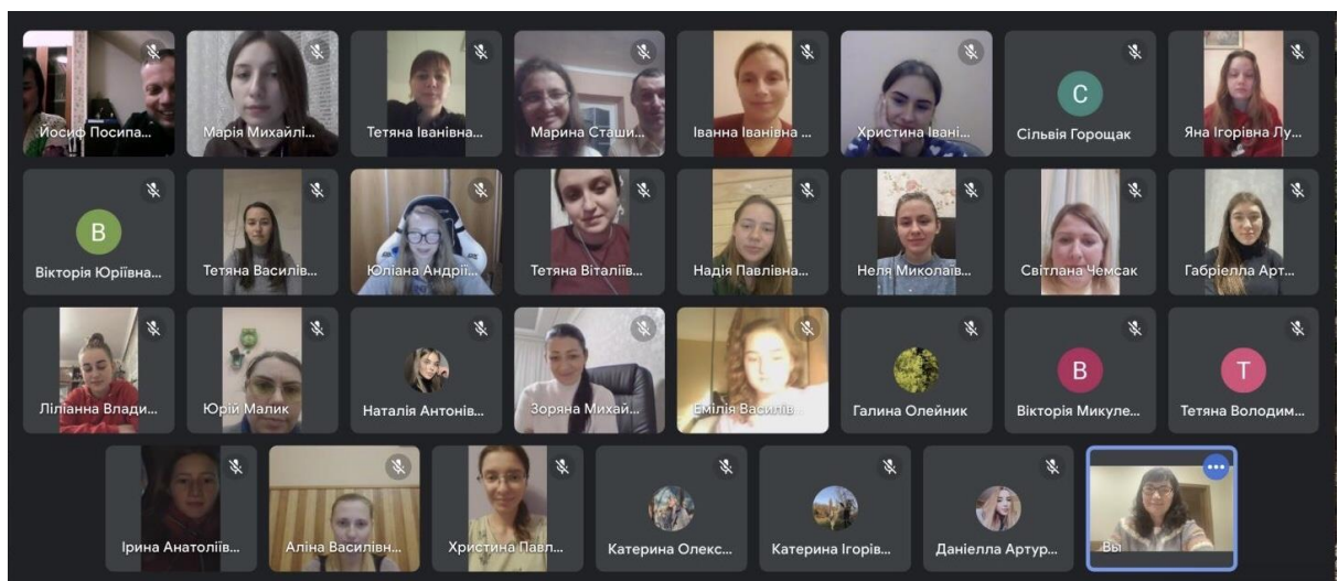
Рис. 1. Проведення курсів з інклюзивної освіти он-лайн