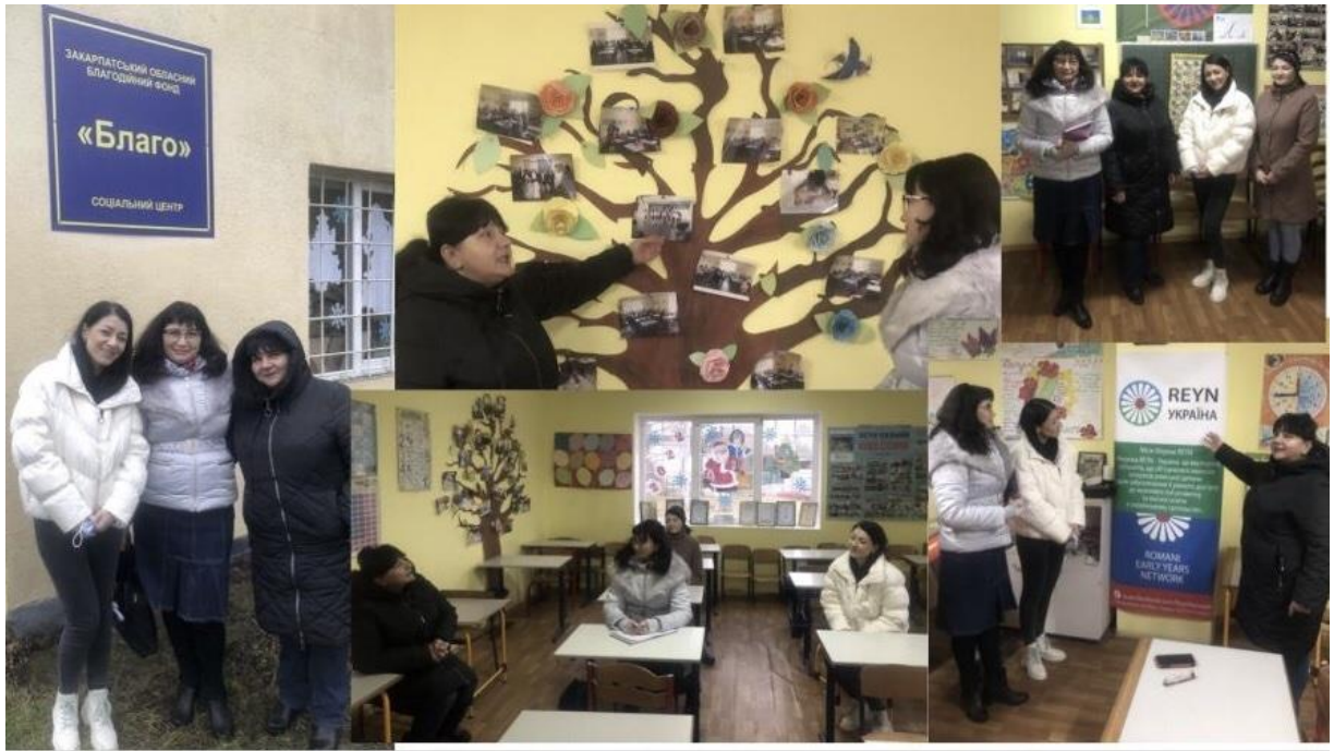
Рис. 3. Зустріч представників кафедри загальної педагогіки та педагогіки вищої школи із Закарпатським обласним благодійним фондом «Благо» та ГО «Карпатська фундація»

Отже, висновкуємо, що як під час традиційного, так і під час дистанційного навчання у майбутніх учителів початкової школи формуються компетенції, які дозволяють реалізувати програми інклюзивного навчання. Ці компетенції допоможуть майбутньому вчителю взаємодіяти з дітьми та родиною для вирішення проблем інклюзивної освіти. Також майбутні вчителі початкової школи беруть участь у різних формах (університетських, дистанційних) і видах (семінари, практикуми, тренінги, вебінари, майстер-класи тощо) неформальної освіти, отримують сертифікати, що дозволяє їм здобути додаткові бали.