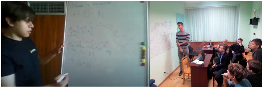
Рис. 2. Стимулювання студентів у публічних виступах на факультеті інформаційних технологій УжНУ

При діючих в УжНУ «Правилах внутрішнього розпорядку» та встановлення контролю за цими правилами, розвивається навичка адаптивності – адже студенти повинні дотримуватися цих правил та норм закладу вищої освіти.