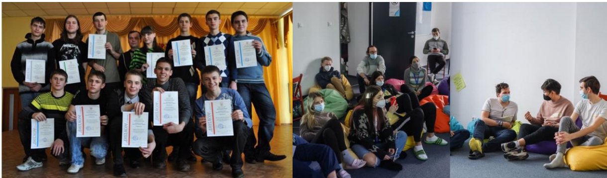
Рис. 1. Проведення організованих заходів, що сприяють об'єднанню студентських груп на факультеті інформаційних технологій УжНУ

Для того, щоб організувати взаємини у студентському середовищі, УжНУ організовує заходи, що сприяють об'єднанню студентських груп (рис. 1). Студенти, беручи участь у заходах вишу та різних конкурсах, розвивають такі soft skills, як міжособистісне спілкування, комунікативні навички та адаптивність.