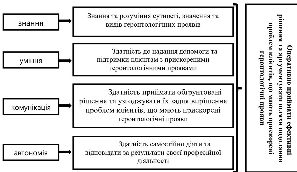
Рис. 1. Здатність до виявлення та надання допомоги й підтримки клієнтам з прискореними геронтологічними проявами

Так, професійна компетентність – важлива складова якісної фахової освіти майбутнього соціального працівника. Саме здатність до виявлення та надання допомоги й підтримки клієнтам з прискореними геронтологічними проявами – є спеціальна фахова компетентність. Більш детально розкриємо її зміст у наступній схемі (рис. 1).