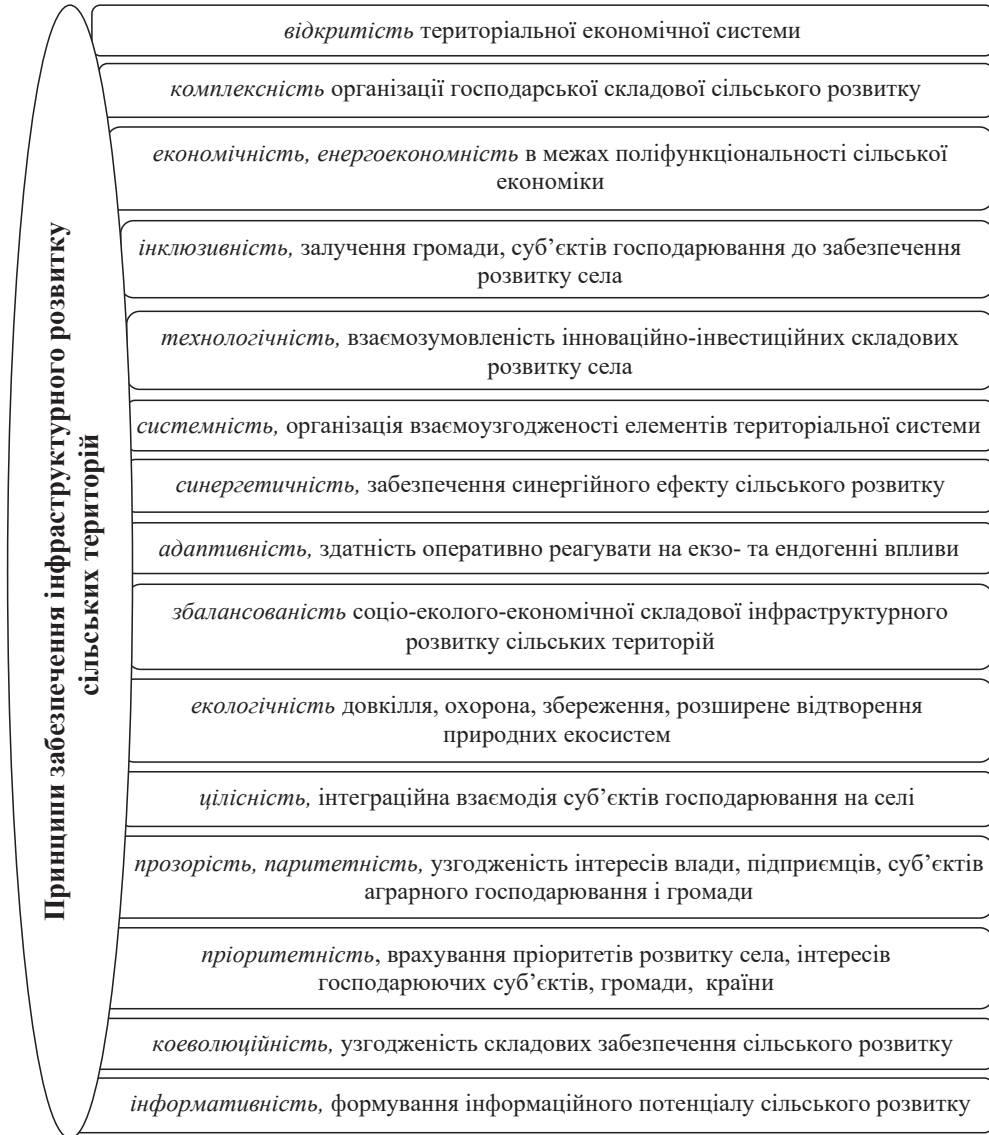
Рис. 2. Основні принципи, врахування яких сприятиме формуванню ефективного інфраструктурного розвитку сільських територій*

Процес формування збалансованого розвитку територій сільської місцевості і їх інфраструктурної складової базується на врахуванні науково обґрунтованих принципів просторово-територіального розвитку (рис. 2).