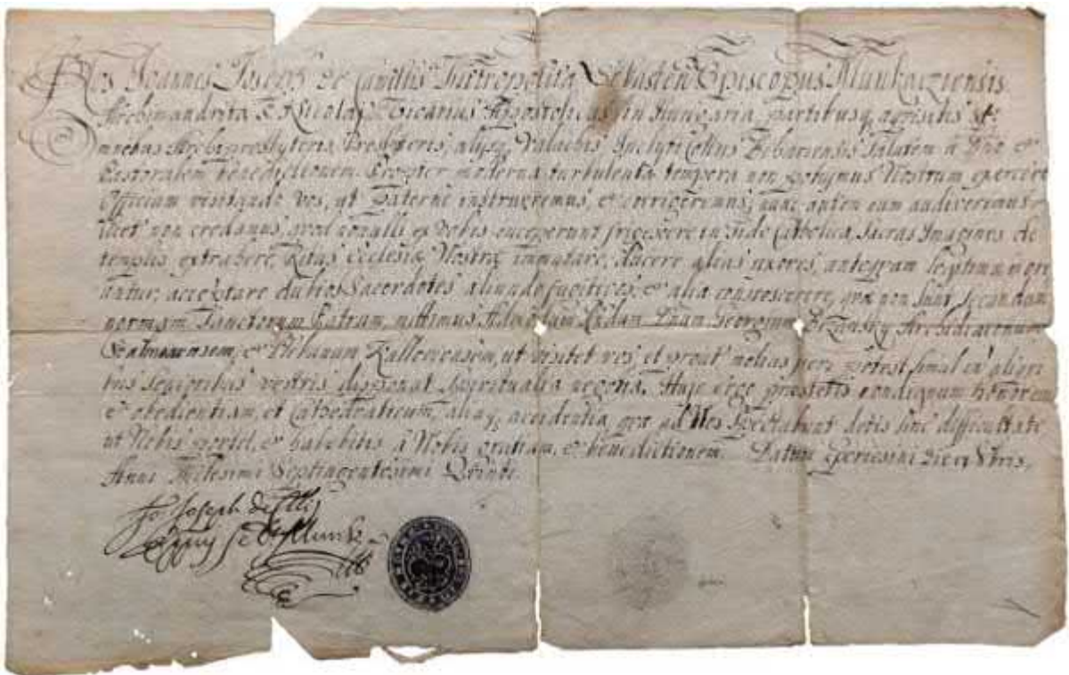
Рис. 1. Печатка і підпис єпископа Іоанна Йосифа де Камеліса, 1705 р. [ДАЗО, ф.151, оп.1, спр. 189, 1 арк.].