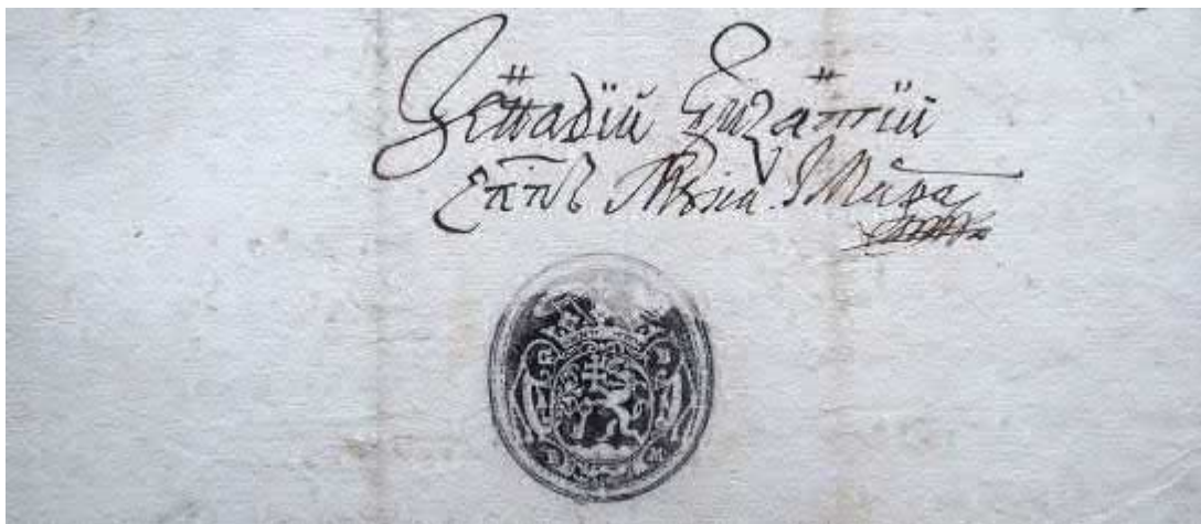
Рис. 9. Печатка і підпис єпископа Юрія Бізанція, 1719 р. [ДАЗО, ф.151, оп.1, спр. 300, арк.1].