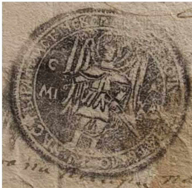
Рис. 3. Печатка Імстичівського монастиря, 1750 р. [ДАЗО, ф.64, оп.1, спр. 340, 1 арк.]. Публікується вперше.