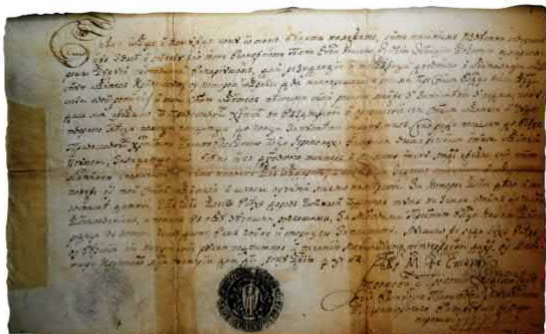
Рис. 6. Печатка Кричівського монастиря, 1725 р. [ДАЗО, ф. 64 оп. 1, спр. 83, 1 арк.].