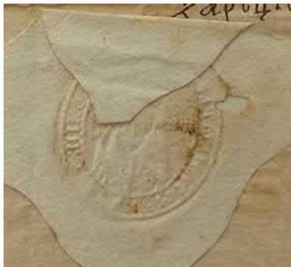
Рис. 10. Печатка Мукачівського монастиря [ДАЗО, ф. 64, оп. 1, спр. 168, 1 арк.].