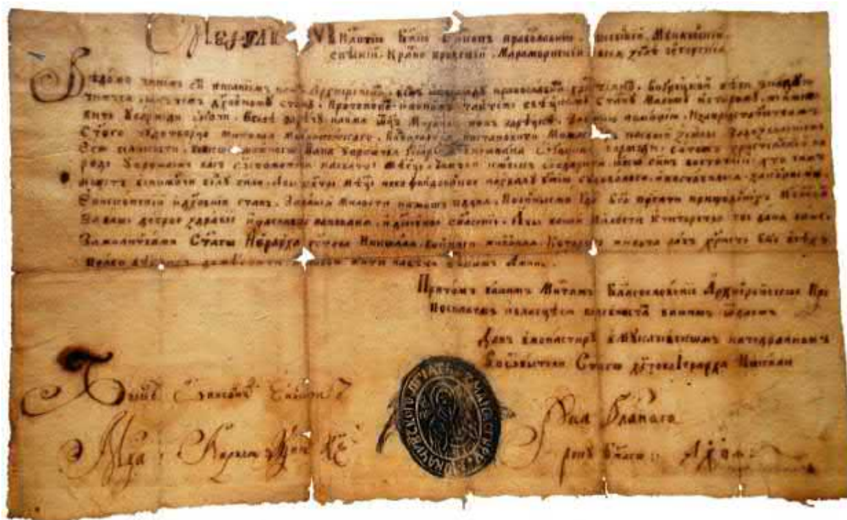
Рис. 4. Печатка Мукачівського монастиря, 1689 р. [ДАЗО, ф.151, оп.1, спр. 93, 1 арк.]. Фото О. Монича.