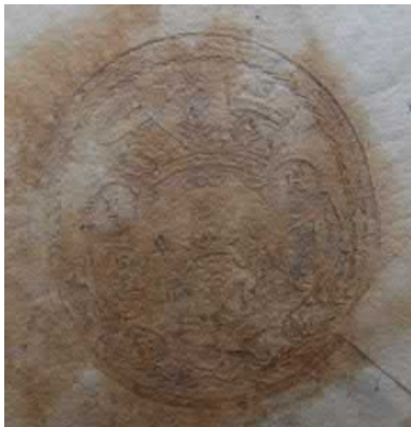
Рис. 5. Печатка єпископа Йосипа Годермарського, 1714 р. [ДАЗО, ф. 151, оп. 1, спр. 244, арк. 1 зв.]. Публікується вперше.