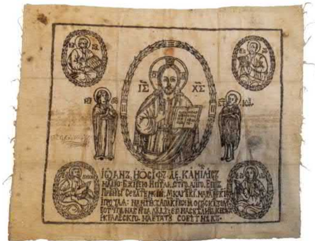
Рис. 2. Богослужбовий Антимінс єпископа Іоанна Йосифа де Камеліса, 1702 р. Фото О. Моница. Публікується вперше.