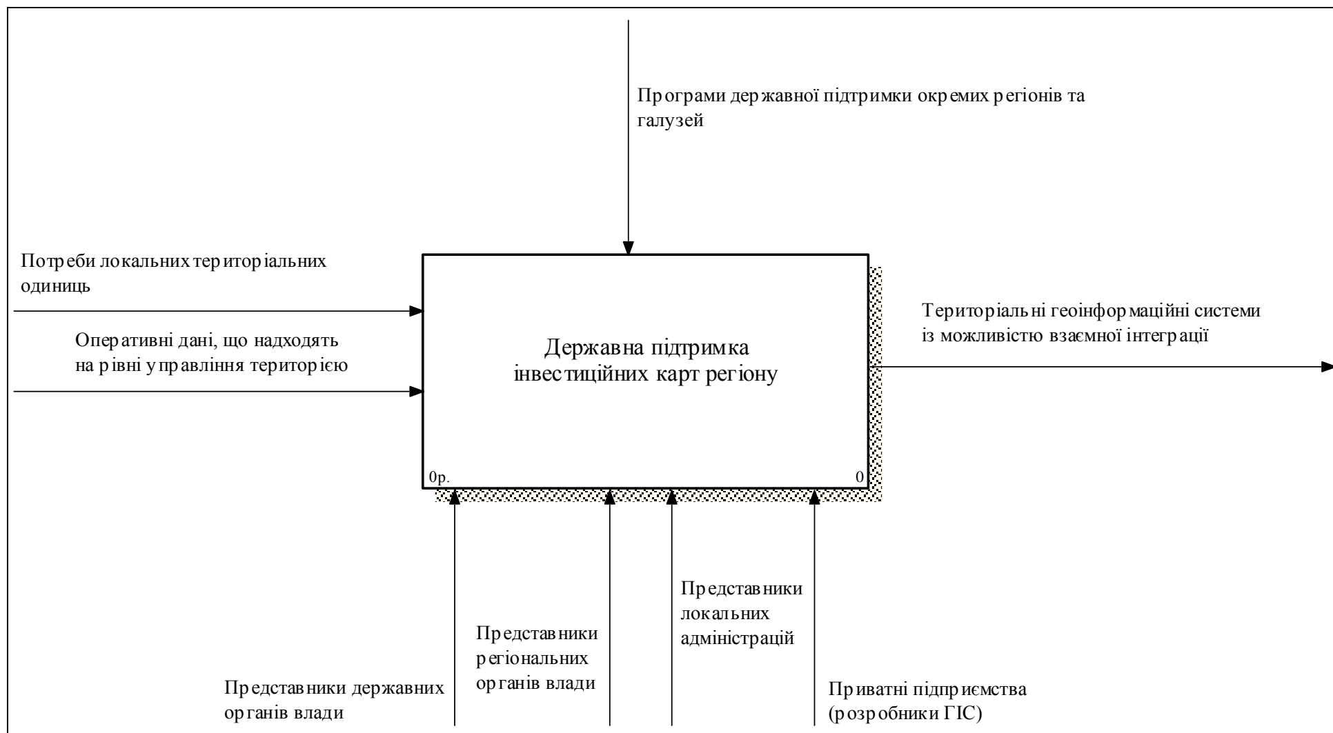
Рис. 3 Контекстна діаграма державної підтримки інвестиційних карт (територіальних геоінформаційних систем) за методологією IDF0