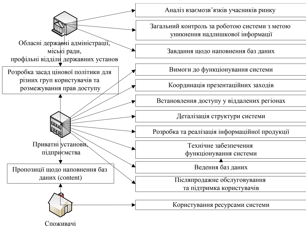
Рис. 2 Розподіл повноважень між користувачами інвестиційної карти

Задалегідь визначений перелік прав та обов'язків сторін не дозволить остаточно монополізувати ринок, оскільки існуватиме контроль з боку органів державної влади, а досвід та ресурси великих підприємств забезпечить насиченість та актуальність інвестиційної карти. Метою створення подібної галузевої регіональної геоінформаційної системи (ГІС) є забезпечення єдиного центру збору та обробки інформації, необхідної для пріоритетних напрямів та об'єктів інвестування.