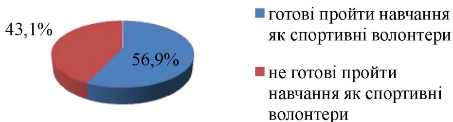
Рис 2. Готовність респондентів пройти навчання як спортивні волонтери

З рис. 1 видно, що найбільша кількість опитаних – 71,5 % відповіли, що хотіли б стати спортивними волонтерами, але не мають достатньо професійної компетенції, тобто практичного досвіду, умінь та знань при вирішенні поставлених завдань, недостатньо мотивованими себе вважають 28,5% респондентів. При цьому готові пройти навчання, стосовно їх підготовки в якості спортивних волонтерів 56,9% опитаних (рис. 2).