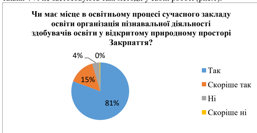
Рис.1. Статистичний розподіл відповідей щодо організації пізнавальної діяльності здобувачів освіти у відкритому природному просторі Закарпаття

Розмірковуючи над впровадженням ідей В. Сухомлинського про «Школу під відкритим небом», виявляємо, що значна кількість педагогів (81 %) проводять заняття у відкритому природному просторі Закарпаття, також 15 % педагогів констатують, що переважають ситуації, де вони використовують природне середовище для урізноманітнення занять і тільки 4 % не застосовують такі методи у своїй роботі (рис.1).