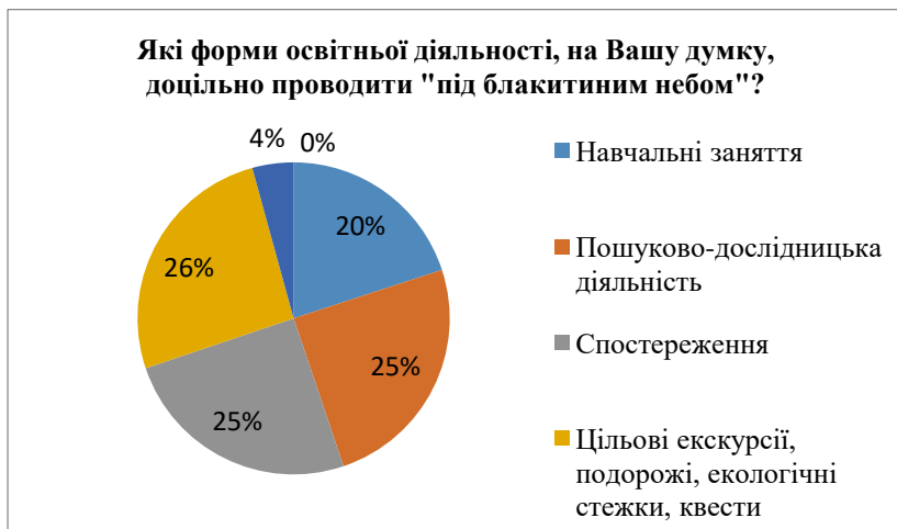
Рис.2. Статистичний розподіл відповідей щодо форм освітньої діяльності «під блакитним небом» (множинний вибір)

Які ж переваги таких занять у природному середовищі? Все залежить від творчого добору педагогом форм, методів, використання прийомів, уміння виробити власну неповторну методичку, яка б ґрунтувалася на індивідуальних вміннях, інтересах й прагненнях, ідеалах вихованців.