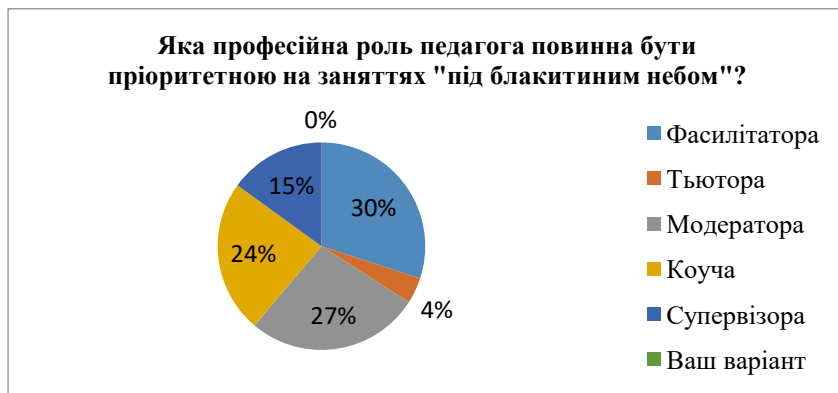
Рис.4. Статистичний розподіл відповідей щодо професійної ролі педагога, яка повинна бути пріоритетною на заняттях «під блакитним небом»

фасилітатора, коуча, тьютора, супервізора, ментора в індивідуальній освітній траєкторії дитини.