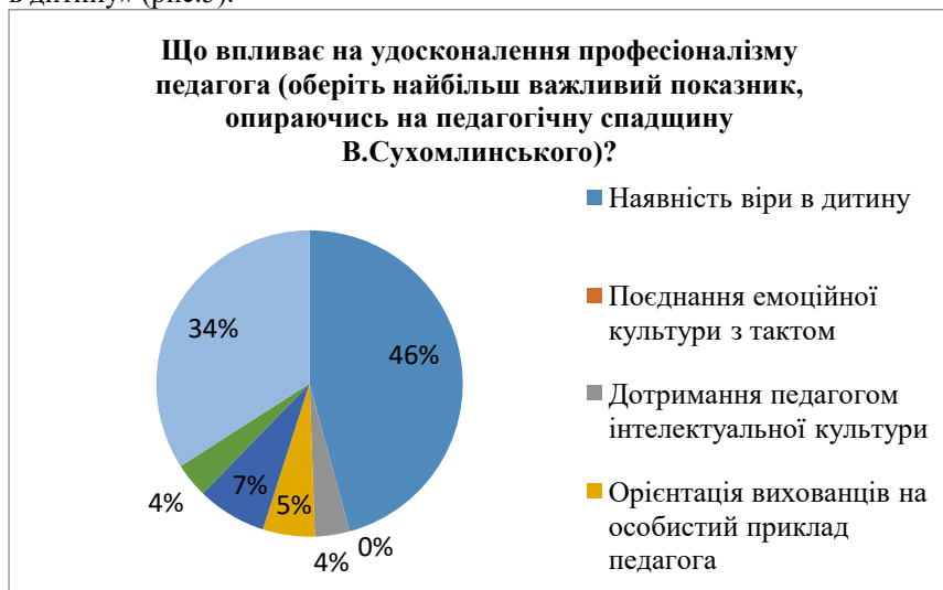
Рис.5. Статистичний розподіл відповідей щодо удосконалення професіоналізму педагога

Що ж впливає на удосконалення професіоналізму вчителя? На думку В. Сухомлинського, це, насамперед, наявність у нього віри в дитину; поєднання емоційної культури з тактом; дотримання вчителем інтелектуальної культури; орієнтація учнів на особистий приклад вчителя; поглиблення, поповнення, удосконалення знань; самоаналіз педагогічної праці; її дослідницький, творчий характер, використання передового педагогічного досвіду; атмосфера багатого духовного життя колективу. Визначний теоретик і практик доводив, що багатогранність і неповторність педагогічних ситуацій вимагає від сучасного вчителя вміння самостійно переосмислювати теоретичні знання, вміння перекладати їх на мову практичних дій, знаходити більш ефективні засоби вирішення педагогічних завдань. Педагоги Закарпаття також зазначають у своїх відповідях фактори удосконалення професіоналізму вчителя, на які вказував В. Сухомлинський, надаючи перевагу складнику «наявність віри в дитину» (рис.5).